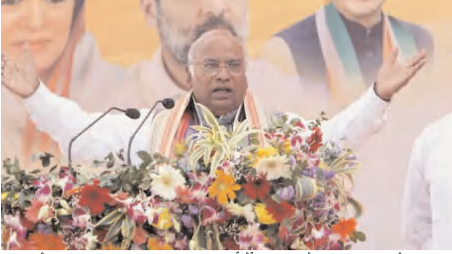
ముడిపెడతే మంచి, చెడులను నిర్మూలన చాలా కష్టమవుతుందన్నారు. మతాన్ని ఒక ఉపకరణంగా మోడి, బీజేపీ వారుకుంటున్నారు. విద్యేష భావాలను సృష్టిస్తున్నారు. వారికి దేశ అభివృద్ధి, ప్రజా సంక్షేమంపై ఎలాంటి ఆసక్తి లేదు. సొంత అధికారం, ఎజెండాపైనే వారి దృష్టంతా ఉంది' అని ఖర్గే విమర్శించారు. కాంగ్రెస్, ఆ పార్టీ నేతలను చూసి

దెహ్రాడూన్,జనవరి29 : ప్రధాన మంత్రి నరేంద్ర మోడీ తనను తాను విష్ణుమూర్తి 11వ అవతారంగా అనుకుంటున్నారని, మతాన్ని రాజకీయాలతో ముడిపెడుతున్నారని కాంగ్రెస్ అధ్యక్షుడు మల్లికార్జున్ ఖర్గే నిశిత విమర్శలు చేశారు. ప్రజలు ఉదయం లేచగానే దేవీదేవతలు, గురువుల ముఖాలు చూడడానికి బదులు తన ముఖమే చూడాలని ప్రధాని కోరుకుంటున్నారని అన్నారు. దెహ్రాడూన్ లోని బన్సా స్మార్ట్ గ్రాంట్స్ లో ఏర్పాటు చేసిన బహిరంగ సభలో ఖర్గే మాట్లాడుతూ, విష్ణుమూర్తి దశావతారాలు గురించి అందరికీ తెలుసునని, ప్రధాని ఇప్పుడు విష్ణువు 11వ అవతారంగా అనిపించుకునే ప్రయత్నాలు చేస్తున్నారని అన్నారు. మతపరమైన సెంటిమెంట్లను ఉపయోగించుకుని ఈవిధాని లోక్ సభ ఎన్నికల్లో గెలవాలనుకుంటున్న బీజేపీని తిప్పికొట్టాలని ప్రజలను కోరారు. మతాన్ని రాజకీయాలతో