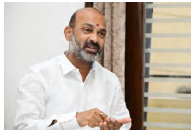
పెద్ద మేధావిలాగా పోతే కొడతారని బండీ సంజయ్ దుయ్యబట్టారు. బండీ సంజయ్ ఇంకా మాట్లాడుతూ... జీవీలలో బీఆర్ఎస్ ఒక్క రూపాయి కూడా ఇవ్వలేదన్నారు. కేంద్రం ఇచ్చిన నిధులను దారి మళ్లించారని ఆరోపించారు. సర్పంచ్ లు అప్పుల పాలయ్యారని... సర్పంచ్ లు ఆందోళనకు మద్దతు ఇస్తామన్నారు. సర్పంచ్ లతో పనులు చేయించి.. బిల్లులు ఇవ్వలేదన్నారు. గత ప్రభుత్వం పేరు చెప్పి.. ఈ ప్రభుత్వం తప్పించుకోవడంపై హితవుపలికారు. సర్పంచ్ ల సమస్యలపై అడిగే హక్కు బీఆర్ఎస్ కు లేదన్నారు. బీఆర్ఎస్ కొత్త డ్రామా మొదలు పెట్టిందన్నారు. తెలంగాణలో పది ఎంపీ సీట్లు గెలుస్తామని బండీ సంజయ్ ధీమా వ్యక్తం చేశారు.

హైదరాబాద్: కేటీఆర్, బండీ మధ్య మాటల యుద్ధం తారా స్థాయికి చేరింది. మాజీ మంత్రి, బీఆర్ఎస్ వర్కింగ్ ప్రసిడెంట్ కేటీఆర్ కొంటర్లు.. బీజేపి ఎంపీ బండీ సంజయ్ ప్రత్యోకంబర్లతో కరీంనగర్ రాజకీయాల వేడిక్కుతున్నాయి. పార్లమెంట్ ఎన్నికల్లో టార్గెట్ గా బీఆర్ఎస్, బీజేపి పార్టీలు ఒకరిపై ఒకరు నిప్పులు చెరుగుతున్నాయి. తాజాగా మరోసారి కేటీఆర్ పై బండీ సంజయ్ తీవ్రస్థాయిలో విరుచుకుపడ్డారు. పనిలో పనిగా మాజీ ముఖ్యమంత్రి కేసీఆర్ పైనా వ్యాఖ్యలు చేశారు. నేను మరం పెట్టుకుంటే.. మీ ఆయ్య బార్ పెట్టుకుంటారు.. నువ్వు మనీడు పెట్టుకుని నమాజ్ చేసుకుంటారు ఉండం అంటూ కేటీఆర్ పై సైబర్ విసిరారు. యూదాధిని వ్యాపార కేంద్రం చేశారని మండిపడ్డారు. కరీంనగర్ బీఆర్ఎస్ అభ్యర్థి నాసికడని.. కేటీఆర్ కూడా నాసికడ అని అన్నారు. కరీంనగర్ బీఆర్ఎస్ అభ్యర్థి