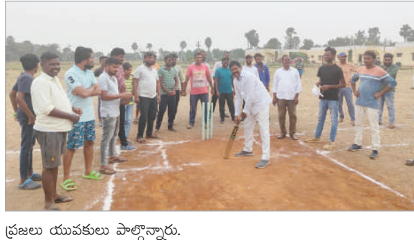
ప్రజలు యువకులు పాల్గొన్నారు.

ప్రాంత క్రీడలు ప్రతి ఒక్క క్రీడాకారులు చక్కటి ప్రదర్శన ఇచ్చి గ్రామస్థాయి నుంచి జాతీయ స్థాయి వరకు మీ ప్రదర్శనలు తీయాలని, భవిష్యత్తులో ఇలా రంగంలో అత్యున్నత స్థాయికి ఎదిగి నడికూడ మండల ప్రాంతానికి కూడా మంచి పేరు వచ్చే విధంగా కృషి చేయాలని తెలిపారు. క్రీడల్లో గెలుపు ఓటములు సహజమే, ఓడిపోయినా నిరంతరం పడకూడదు. గెలిచామి అని గర్వపడకూడదు. స్వేచ్ఛాపూర్వకంగా క్రీడలను ఆడాలి. ఓడిపోయినా ఓటమి విజయానికి వంగుతూ భావించాలి అని అన్నారు. ఇప్పుడు ఉన్న పరిస్థితి లో సెల్ ఫోన్ తో అన్ని రంగాల్లో ముందు ఉన్న ఈ క్రీడాకారుల నిర్వహించటం ఈ వరకే గ్రామ యువత ఆదర్శమన్నారు. క్రీడలకు ప్రోత్సాహిస్తున్న మాజి జైల్లో కు కృతజ్ఞతలు తెలిపారు, ఈ కార్యక్రమంలో పలువురు గ్రామ