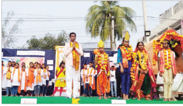
కరీంనగర్, జనవరి 22 (నినాదం స్టూన్) శ్రీరాముడు ధర్మానికి మార్గదర్శకుడని ధర్మ రక్షణకై పాటుపడిన గొప్ప