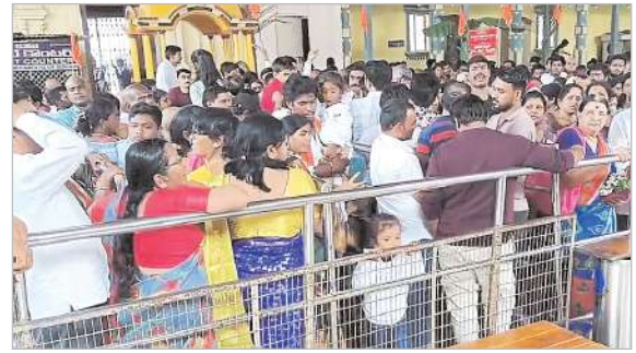
శోభాయాత్ర నిర్వహించారు. శోభాయాత్ర లో 500 కాషాయ జెండా లో ప్రదర్శన ఆద్యంతం కన్నుల పండుగగా సాగింది. అనంతరం భద్రాచల ఆలయం లో సంక్షేప రామాయణ హవనం, సుందరకాండ పారాయణం, సాయంత్రం ఆలయ ప్రాంగణంలో దీపోత్సవం నిర్వహించారు. సాంస్కృతిక కార్యక్రమాల భక్తులను విశేషంగా ఆకట్టుకున్నాయి. రామాలయ ప్రాంగణం అంతా శ్రీరామ నామ స్మరణతో మారుమోగింది.