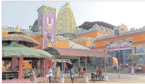
ప్రాంగణం అంతా కిటకిటలాడింది. ఆలయంలో మూలవరలను దర్శించుకునేందుకు క్యూలైన్లో భక్తులు బారులు తీరారు. దీంతో భక్తుల ఉచిత దర్శనానికి మూడు గంటల సమయం, ప్రత్యేక ప్రవేశ దర్శనానికి గంట సమయం పట్టింది. సోమవారం ప్రత్యేక పూజలలో భాగంగా సువర్ణ పుష్పార్చన, భద్రాచల రామాలయం సన్నిధానం నుండి అంబేద్కర్ సెంటర్ వరకు

భక్తులు జిల్లా ప్రతినిధి, జనవరి 23 (నినాదం న్యూస్) : అయోధ్య రామ మందిరంలో బాల రాముని విగ్రహ ప్రాణప్రతిష్ఠ తరువాన్ని పురస్కరించుకొని భారతదేశ వ్యాప్తంగా అన్ని ఆలయాల్లో ప్రత్యేక పూజలు నిర్వహించారు. ఈ క్రమంలో దక్షిణ అయోధ్యగా విరాజిల్లుతున్న భద్రాచల శ్రీ సీతారామచంద్ర స్వామివారి దర్శనానికి పెద్ద సంఖ్యలో భక్తులు పోటీకొన్నారు. భద్రాచల క్షేత్రంలో స్వామివారి దివ్య సన్నిధానమున అయోధ్య మహాత్మ్యన్ని పురస్కరించుకొని ఉదయం నుండి ప్రత్యేక పూజలు మరియు పారాయణాలు, కీర్తనలు, శోభాయాత్రలను ఎంతో భక్తిశ్రద్ధలతో నిర్వహించారు. ఎంతో ప్రత్యేకత కలిగిన ఈ రోజున భద్రాచల రామయ్యను దర్శించుకుంటే సాక్షాత్తు అయోధ్య రాముని దర్శన భాగ్యం కలిగినట్లనే భావిస్తూ వివిధ ప్రాంతాల నుండి భక్తులు వేల సంఖ్యలో భద్రాచల కేంద్రానికి స్వామివారిని దర్శించుకుని సాక్షాత్తు అయోధ్య బాల రాముడి దర్శన భాగ్యం కలిగినట్లు తలచారు. వేలాది సంఖ్యలో రామయ్య దర్శనానికి తలచిన భక్తులతో ఆలయ