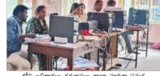
లోని లబ్ధిదారుల దరఖాస్తుల డాటా షార్టిగా సమర్థవంతంగా ఎంట్రీ చేయడం జరిగిందని తెలిపారు. దరఖాస్తుల డాటా ఎంట్రీ పూర్తిగా మండల రెవెన్యూ అధికారులు, మండల అభివృద్ధి అధికారుల ప్రత్యేక పర్యవేక్షణలో డేటా ఎంట్రీ చేశామన్నారు. డేటా ఎంట్రీలో ఆధార్ నంబర్, తెల్ల రేషన్ కార్డును ప్రామాణికంగా తీసుకొని చేశామని తెలిపారు. ప్రజాపాలన కార్యక్రమంలో భాగంగా ఐదు ప్రత్యేక పథకాలకు దరఖాస్తులను స్వీకరించామని మహాలక్ష్మి, రైతు భరోసా, గృహ జ్యోతి, ఇందిరమ్మ ఇల్లు, చేయూత, యువ వికాసం పథకాలు ఉన్నాయని అన్నారు.