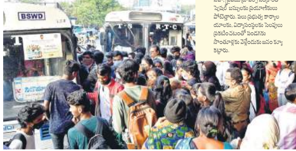
హైదరాబాద్/విజయవాడ, జనవరి 12 (బనారం న్యూస్):

సంక్రాంతి సందర్భంగా జనం ఇప్పటికే తూర్పుకు తరలివెళ్తున్నారు. హైదరాబాద్ నగరంలోని పలు బస్ ప్రయాణికులు టిఎంఎల్ కు వచ్చారు. సొంతూళ్లకు వెళ్తున్న వారి వాహనాలు బస్టాపుల్ వద్ద పెద్ద సంఖ్యలో బారులు తీరారు. బస్టాపుల్లో సహజంగానే ట్రాఫిక్ సంక్రాంతి సెషన్లలో బస్సులకు ప్రయాణీకులు పోయారు. పలు ప్రభుత్వ కార్యాలయాలకు, విద్యాసంస్థలకు వెళ్తున్న ప్రజలను టోల్ ప్లాజాల వద్ద కట్టారు.