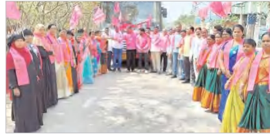
మేయర్, దుండిగల్ మున్సిపాలిటీ చైర్మన్, వైస్ చైర్మన్, అధ్యక్షులు, ప్రజా ప్రతినిధులు, నాయకులు, కార్యకర్తలు తదితరులు పాల్గొన్నారు.