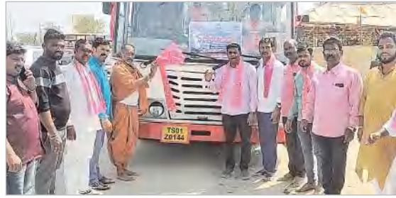
పార్టీ శ్రేణులు భారీగా తరలి వెళ్లారు. ఈ కార్యక్రమంలో ఆయా డివిజన్ల కార్యకర్తలు, నిజాంపేట్ కార్యకర్తల మేయర్, డిప్యూటీ