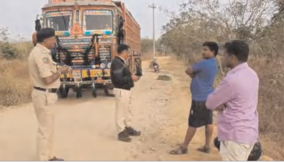
టన్నుల బొగ్గును గుర్తించి సీజ్ చేశారు. మొత్తం బొగ్గు విలువ సుమారు రెండు లక్షల రూపాయలు ఉంటుందని సింగరేణి అధికారులు తెలిపారు.