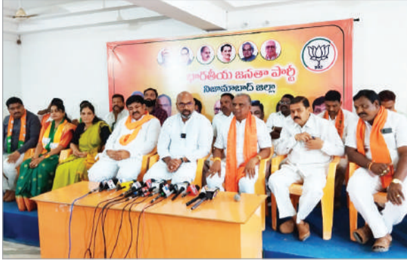
పోరాడుతామని అన్నారు. నిజామాబాద్ లో ఎంపీగా పోటీ చేస్తామని సవాల్ చేసిన కల్యాణం కవిత్వ కనిపించడం లేదని అన్నారు. అమేను పార్లమెంట్ ఎన్నికలలో పోటీ చేయాలని పార్టీ నాయకులు కార్యక్రమ నిర్వహణకు

నిజామాబాద్ ప్రతినీటి, ఫిబ్రవరి 13 (నినాదం న్యూస్) రాజీయే పార్లమెంట్ ఎన్నికలలో బీజేపీ తెలంగాణ రాష్ట్రంలో అత్యధిక స్థానాల్లో గెలిచి అతి పెద్ద పార్టీగా అధిష్టమందిని నిజామాబాద్ ఎంపీ ధర్మపురి అల్లం జోన్లో చేపట్టారు. మంగళవారం నిజామాబాద్ జిల్లా పార్టీ కార్యాలయంలో ఎంపీ అల్లం చిట్ చాట్ గా మాట్లాడుతున్న... బీజేపీలో ఘోర వాపని నడుస్తోంది బిఆర్ఎస్ ఖాళీఅవుతుంది అన్నారు. బీజేపీలో పోటీ ఎక్కువగా ఉంటుంది, పార్లమెంటు ఎన్నికల కోసం పార్టీ శ్రేణులు సిద్ధంగా ఉన్నాయి అన్నారు. మూడో సారి కూడా కేంద్రంలో బీజేపీ అధికారంలోకి వస్తుంది మోడీ మూడోసారి ప్రధాని కానున్నారు అన్నారు. దేశ వ్యాప్తంగా బిజిపికి 68 శాతం ఓట్లున్నాయి..ఉత్తర భారత్ దేశంలో కాంగ్రెస్ కు ఒక్క పార్లమెంటు సీటు కూడా రాదు అన్నారు. నిజామాబాద్ పార్లమెంట్ ఛంబర్లో 5 లక్షల ఓట్లు లక్షంగా పార్లమెంట్ ఎన్నికలలో