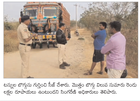
టన్నుల బొగ్గును గుర్తించి సీజ్ చేశారు. మొత్తం బొగ్గు విలువ సుమారు రెండు లక్షల రూపాయలు ఉంటుందని సింగరేణి అధికారులు తెలిపారు.