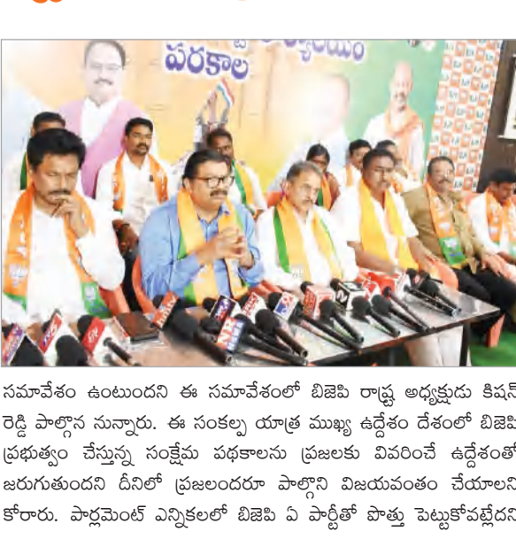
సమావేశం ఉంటుందని ఈ సమావేశంలో బిజెపి రాష్ట్ర అధ్యక్షుడు కిషన్ రెడ్డి పాల్గొని సున్నారు. ఈ సంకల్ప యాత్ర ముఖ్య ఉద్దేశం దేశంలో బిజెపి ప్రభుత్వం చేస్తున్న సంక్షేమ పథకాలను ప్రజలకు వివరించే ఉద్దేశంతో జరుగుతుందని దీనిలో ప్రజలందరూ పాల్గొని విజయవంతం చేయాలని కోరారు. పార్లమెంట్ ఎన్నికల్లో బిజెపి ఏ పార్టీతో పాటు పెట్టుకోవద్దని