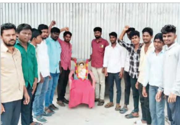
ఆజాద్ బ్రిటీష్ వరాలు పాలన అంతం కోసం, ప్రజల విముక్తి కోసం పోరాడిన తీరు ఆదర్శం అని అన్నారు. నేటి యువత చంద్రశేఖర్ ఆజాద్ ఆధునికీకరణలో నడుస్తూ నేడు దశాబ్ది కాలంగా కేంద్రంలో అధికారంలో