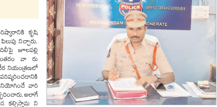
సందర్భంగా పోలీస్ స్టేషన్ సిబ్బందికి తగు సూచనలు జారీ చేశారు.