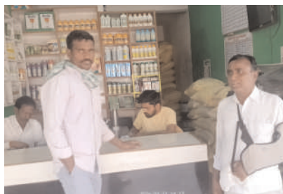
ఉంటే దీని వెనకాల 7 కమిషన్ వస్తుంది. కానీ ఒక్కోక్క బ్యాగ్ వెనకాల 50-60 రూపాయలు