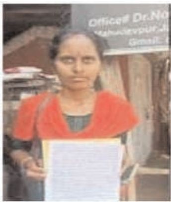
బాధితురాలు రాగం విజయ శనివారం పాత్రికేయుల ముందు తన ఆవేదనను

జయశంకర్ భూపాలపల్లి జిల్లా, ఫిబ్రవరి 11 (సినాదం న్యూస్): యశంకర్ భూపాలపల్లి జిల్లా మహాదేవపూర్ మండల్ ఎమ్మార్వో ఆఫీస్ లో జరిగిన సంఘటన నువ్వు ఎవరితో చెప్పుకున్నా నాకేం కాదంటు దురుసు పదజాలంతో సమాధానం గతంలో కూడా ఇలాంటి వార్తలు వచ్చాయి కాని వెలుగులోకి రానందున పట్టించుకోని అధికారులు..? తన ఓటు హక్కు తొలగించినందుకు విషయం తెలుసుకోవడానికి మహాదేవపూర్ తాసిల్దార్ కార్యాలయానికి వెళ్లినందుకు నువ్వు చెప్తే నీ భర్త మరణ ధ్రువీకరణ పత్రం కూడా ఇస్తానని తాసిల్దార్ కార్యాలయంలో ఆపరేటర్ దురుసుగా సమాధానం ఇచ్చాడని