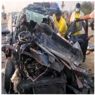
సంద్యాల/హైదరాబాద్, మార్చి 6 (నినాదం న్యూస్):

మొత్తం ఐదుగురు మృతి చెందినట్లు పోలీసుల వెల్లడి మృతులంతా హైదరాబాద్ అల్వాల్ వాసులుగా గుర్తింపు