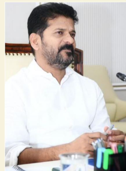
హైదరాబాద్, మార్చి 6 (నినాదం న్యూస్):

విజిలెన్స్ అండ్ ఎన్ఫోర్స్మెంట్ కు బాధ్యతలు