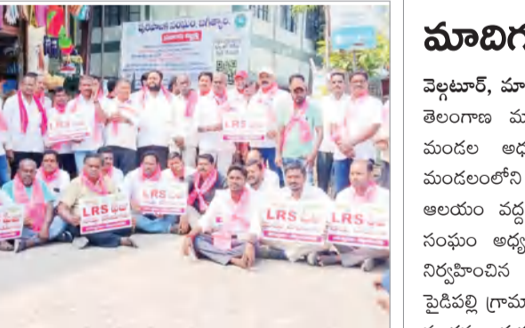
సందర్భంగా పలువురు నాయకులు ఎల్ ఆర్ ఎస్ ఫీజు రద్దు చేయాలని డిమాండ్ చేశారు. ఈ కార్యక్రమంలో పెద్ద సంఖ్యలో పార్టీ నాయకులు, కార్యకర్తలు పాల్గొన్నారు.

జగిత్యాల, మార్చి 6 (నినాదం న్యూస్) ఎల్ ఆర్ ఎస్ ఫీజుకు వ్యతిరేకంగా ఆ పార్టీ పిలుపు మేరకు బుధవారం నాడు జగిత్యాల టీఆర్ఎస్ పార్టీ నాయకులు మున్సిపల్ ఆఫీసు ఎదుట బైకాయించి నిరసనగా కార్యక్రమంను నిర్వహించారు. జగిత్యాల టౌన్ లో దాదాపు 8000 మైగ దరఖాస్తులు క్రమబద్ధీకరణ కొరకు పెండింగ్ లో ఉన్నాయని, కాంగ్రెస్ ఎన్నికల హామీలో భాగంగా ఉచిత ఎల్ ఆర్ ఎస్ అమలు చేయాలని, లో అవుట్ ప్రకారం నిర్మాణాలు చేపట్టాలని, మాస్టర్ ప్లాన్ వెంటనే అమలు చేయాలని డిమాండ్ చేశారు. అనంతరం మున్సిపల్ కమిషనర్ కు వినతి పత్రాన్ని సమర్పించారు. ఈ