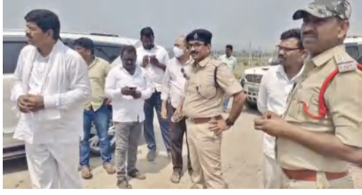
గ్యారంటీలలో ఇందిరపూ ఇల్లు పథకాన్ని పథకాన్ని లాంచనంగా ప్రారంభించనున్నట్లు అధికారులు వెల్లడించారు. సభకు ప్రజలు భారీగా తరలివచ్చే అవకాశం ఉండటంతో వేసవికాలం కావడంతో సభా స్థలము వద్ద దాహార్తిని తీర్చే తీర్చే మంచినీటి సౌకర్యం కూడా ఏర్పాటు సిద్ధం చేస్తున్నట్లు స్థానిక