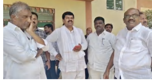
ఎమ్మార్సీ రాఘవరెడ్డి తెలిపారు. సభా స్టలానికి ప్రజలను పెద్దఎత్తున తరలించేందుకు స్థానిక ఎమ్మెల్యే ఆధ్వర్యంలో వాహనాలను కూడా ఏర్పాటు చేస్తున్నట్లు తెలిపారు. ఈ సమావేశంలో రెవెన్యూ అధికారులు పోలీసు అధికారులు తదితరులు పాల్గొన్నారు.