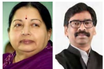
న్యూఢిల్లీ, మార్చి 22 (నివాసం న్యూస్):

లిక్కర్ కేసులో ఆమ్ ఆర్ఎస్సీ పార్టీ అధినేత, ముఖ్యమంత్రి కేజీ వాల్ ను ఈడీ అధికారులు అరెస్టు చేయడంతో ఇప్పుడు అనేక ప్రశ్నలు ఉదయిస్తున్నాయి. సిఎంగా అధికారంలో ఉండగా ఓ రాష్ట్ర ముఖ్యమంత్రిని దర్యాప్తు సంస్థలు అరెస్టు చేయవచ్చు అనే సందేహాలు సర్వత్రా వ్యక్తం అవుతున్నాయి. దీనికి చట్టం ఏం చెబుతోంది..? అందుకు సంబంధించిన విధివిధానాలు ఏమిటి అనే విషయాలు ఇప్పుడు చర్చ నీయాంశంగా మారాయి. అయితే తమిళనాడు సిఎంగా అశ్వినీ సమయంలో జయలలితపై అవినీతి కేసులు నమోదయ్యాయి. ఆమెను అరెస్టు చేసే సమయం రావడంతో రాజీనామా చేసి, తన స్థానంలో పన్నీరు సెల్వం సుమన్ చేసి సందర్భం ఉంది. తరువాతి 2లో..