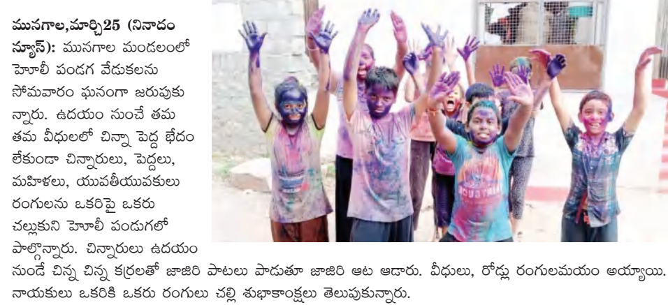
మునగాల, మార్చి 25 (నినాదం స్పాస్): మునగాల మండలంలో హెబ్బా వందల వేడుకలను సోమవారం ఘనంగా జరుపుకున్నారు. ఉదయం నుంచే తమ తమ వీధులలో చిన్నా పెద్ద ఖేదం లేకుండా చిన్నారులు, పెద్దలు, మహిళలు, యువతీయువకులు రంగులను ఒకరిపై ఒకరు చల్లుకుని హెబ్బా వందలలో పాల్గొన్నారు. చిన్నారులు ఉదయం నుండే చిన్న కర్రలతో జాజిరి పాటలు పాడుతూ జాజిరి ఆట ఆడారు. వీధులు, రోడ్లు రంగులమయం అయ్యాయి. నాయకులు ఒకరికి ఒకరు రంగులు చల్లి శుభాకాంక్షలు తెలుపుకున్నారు.