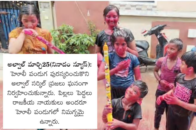
అల్వాల్ మార్చి 25 (నినాదం స్పాస్): హెబ్బా వందల పురస్కారాలను అల్వాల్ సర్కిల్ ప్రజలు ఘనంగా నిర్వహించుకున్నారు. పిల్లలు పెద్దలు రాజకీయ నాయకులు అందరూ హెబ్బా వందలలో నిమగ్నమై ఉన్నారు.