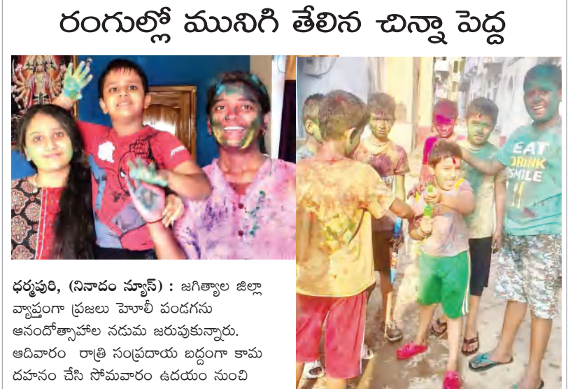
భర్మపూరి, (నినాదం స్పాస్): జగిత్యాల జిల్లా వ్యాప్తంగా ప్రజలు హెబ్బా వందలను ఆనందోత్సాహాల నడుమ జరుపుకున్నారు. ఆదివారం రాత్రి సంప్రదాయ బద్ధంగా కామ దహనం చేసి సోమవారం ఉదయం నుంచి