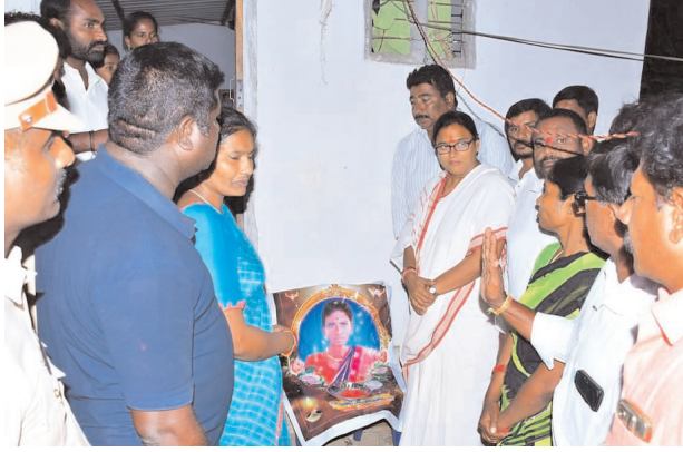
బాధ్యతగా ప్రభుత్వం దృష్టికి చేతులెత్తి జోడిస్తున్న ప్రయాణ తీసుకువెళ్లి, కచ్చితంగా సాయం సమయంలో జాగ్రత్తలు పాటించండి... చేస్తానని హామీ ఇచ్చారు. దయచేసి ఆత్రుతగా, ఆశ్రద్ధగా, మితిమీరిన