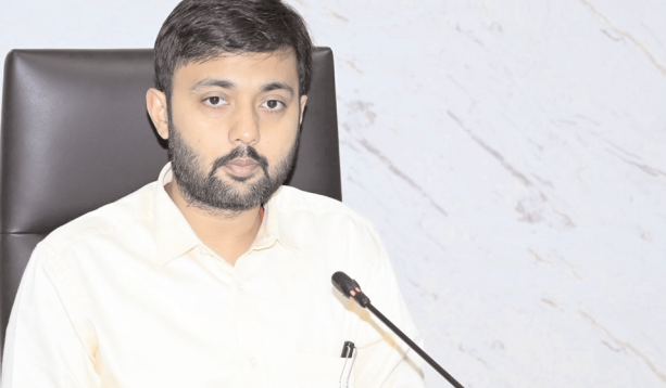
రెవెన్యూ అధికారులు బృందంగా ఏర్పడి తీసుకొని నివేదికలు అందజేయా ధరణి పెండింగ్ దరఖాస్తుల పరిశీలన లన్నారు. సంవత్సర కాలంగా పెండిం కార్యక్రమం చేపట్టాలని క్షేత్రస్థాయిలో గ్లో ఉన్న దరఖాస్తులన్నీ స్వయంగా పర్యటిస్తూ వాస్తవాలను పరిగణనలోకి పరిశీలన చేయాలని తహసీల్దార్ తుది