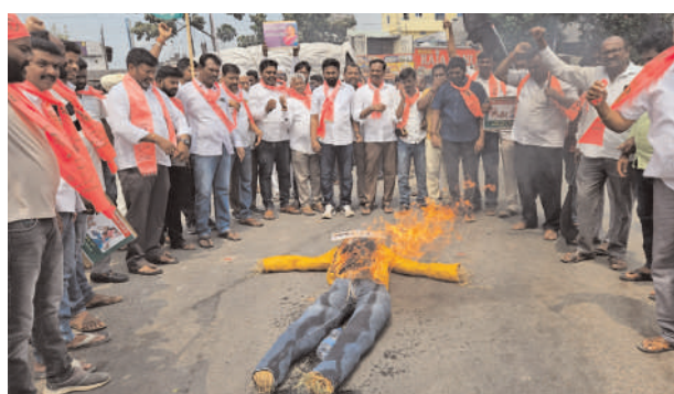
దినాలు వస్తుండడంతో ఎమ్మెల్యే కల్యాణకుంట్ల కవితను ఈడి అధికారులు అప్రజాస్వామికంగా అరెస్టు చేశారని దానిని తీవ్రంగా ఖండిస్తున్నామని ఆయన పేర్కొన్నారు. శనివారం పట్టణంలోని బస్టాండ్ వద్ద బిఆర్ఎస్ శ్రేణులతో కలిసి ఆందోళన