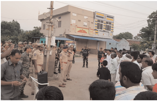
జమ్మికుంట, మార్చి 27 (నినాదం న్యూస్):