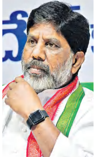
బీఆర్ఎస్ వినియోగదా అని ప్రశ్నించారు. బీఆర్ఎస్ ప్రభుత్వం ఉన్న దగ్గరి నుంచే వరాలు రావల్సిందన్నారు. రిజర్వాయర్లో ఎక్కడ నీళ్లు లేకున్నా అది కేసీఆర్ పుణ్యమేనని చెప్పారు. నీటిని సద్వినియోగం చేసుకోకపోవడం వల్లే ఇప్పుడు ఈ పరిస్థితి వచ్చిందని ఆందోళన వ్యక్తం చేశారు. కాశీశ్వరం నీళ్లు లేకుండా కేసీఆర్ చేశారని భట్టివిక్రమార్క మండిపడ్డారు.