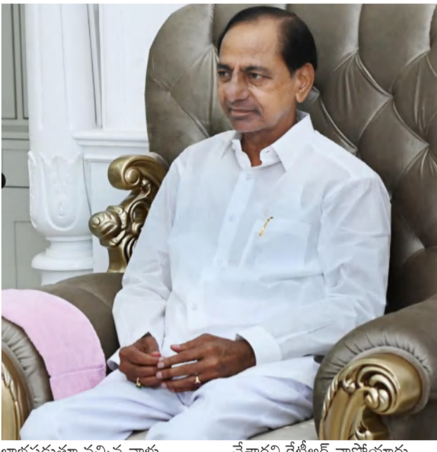
లాభపడుతూ వచ్చిన వాళ్లు ఇప్పుడు ఒక్కొక్కరుగా అయినను విడివి వేళ్లుపోతున్నారు. ఉద్యమకారులను అవమానించిన కెసిఆర్ ఇప్పుడు చిల్లరగాళ్లు అని వ్యాఖ్యానించడం ఆయన ఆక్రోశాన్ని వెల్లడం క్రిందగా చేసింది. అనాడు అవసరార్థం కెసిఆర్ వద్దకు వచ్చిన వారు... ఇప్పుడు తమ అవసరార్థం మళ్లీ పార్టీ మారుతున్నారు. అనాడు ఎంత అవకాశవచనం ఉండో... ఇవాళ కూడా అంతే అవకాశవచనం వుంది. ఇటీవలే కాంగ్రెస్ లో చేరిన రంజిత్ రెడ్డి, మహేందర్ రెడ్డి తనను సిపిఎమ్ కి చేశారని కేటిఆర్ వాపోయారు. నిజానికి కెసిఆర్ కుటుంబమంతా కలసి ప్రజలను పివ్వేళ్లను చేశామని వారికి మాత్రమే తెలిసిన విద్య, రాజకీయాల్లో పర్యావేంద్ విద్యుత పార్టీ అన్నది ఏనాడో లేకుండా పోయింది. అధికారంలో ఉన్న పార్టీలోనే ఉండడానికి నేతలు ఇష్టపడుతున్నారు. అందుకే కాంగ్రెస్ పార్టీలో చేరడానికి బీఆర్ఎస్ కు చెందిన అనేక మంది ఎన్నికల కోసం కేసిఆర్ ప్రకటించిన అభ్యర్థులలో రంజిత్ రెడ్డి, కడియం కావ్యం కాంగ్రెస్ లోకి

వేళ్లడం బీఆర్ఎస్ పార్టీ దినావస్తను సూచిస్తోంది. మరికొందరు అదే బాటలో ఉన్నారు. తెలంగాణ ఉద్యమంలో మమేకమై పార్టీనే నమ్ముకున్న వారితో ఎవరికీ కూడా బీజేపీ ఇప్పుడు దానినాళ్లలో అవమానం చేశారు. అధికారం వచ్చాక అలాంటి వారిని దూరం పెట్టారు. అందుకే దానినిపోతం కేసిఆర్ ఇప్పుడు అనుభవిస్తున్నారు. కేసిఆర్ పట్ల ఇప్పుడు ప్రజల నుంచి కనీసం సానుభూతి రావడం లేదు. కేసిఆర్ కుటుంబంపై తెలంగాణ సమాజంలో తీవ్ర వ్యతిరేకత కనిపిస్తోంది. కవితను అరెస్ట్ చేసినా ప్రజల్లో ఎక్కడా సానుభూతి రాలేదు. ఆ కుటుంబ వ్యవహారంపై ఇందుకు కారణం అని చెప్పక తప్పదు. అధికారంలో ఉన్నప్పుడు నిరంకుశంగా వ్యవహరించిన కారణంగానే కెసిఆర్ ప్రజాదరణ కోల్పోయారు. చేసిన తప్పిదాలను తెలుసుకుని ఇప్పుడున్న ప్రభుత్వానికి తగిన మంచి సూచనలు చేస్తూ... తెలంగాణ అభివృద్ధికి ముందుకు వస్తే కేసిఆర్ ను మళ్లీ ప్రజలు ఆదరించవచ్చు. రాష్ట్రం విడిపోయిన పదేళ్ల తర్వాత కాంగ్రెస్ పార్టీ అధికారంలోకి రావడానికి కెసిఆర్ అహంకారం ఒక్కటే కారణం ను గుర్తించకుండా ఇంకా విమర్శలు చేస్తే ప్రజల్లో ఉన్న ఆదరణ కూడా పోతోంది.