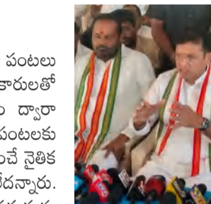
బాబు చెప్పారు. టికెట్ రాలేదని బాధపడే వారికి న్యాయం చేసే అంశాన్ని కూడా పార్టీ పరిశీలిస్తుందన్నారు. ఛోన్ టాపింగ్ అంశంపై స్పందిస్తూ బీఆర్ఎస్ పాలనలో జరిగిన తప్పులన్నీ ఒక్కొక్కటిగా వెలుగు చూస్తున్నారన్నారు. దీనిపై ప్రజలకు సమాచారం చెప్పే పరిస్థితి లేక వర్కలలో బీఆర్ఎస్ అభ్యర్థిగా పోటీ చేయనని కడియం కాష్ట్ర ప్రకటించింది. పార్టీ నుంచి బయటకు వచ్చారని తెలిపారు. రాష్ట్రంలో విద్యుత్ కోతలు ఎక్కడా లేవన్నారు. కరెంట్ కొరత లేకుండా ఉండేందుకు గత ప్రభుత్వం పిల్లపరి, మార్చి మాసాల్లో వినియోగించిన కరెంట్ కంటే ఎనిమిది శాతం అధికంగా కొనుగోలు చేసి మరి సరఫరా చేస్తున్నామన్నారు. అందిస్తున్నారన్నారు. 200 యూనిట్ల లోపు విద్యుత్ వాడుకున్న వినియోగదారులు బిల్లులు కట్టాలిన్న అవసరం లేదని, కరెంట్ కట్టే చేయకుండా అధికారులకు ఆదేశాలు ఇచ్చామన్నారు. ఎదైనా సమస్య ఉంటే మండల పరిషత్, మున్సిపల్ కార్పొరేషన్లలో విసతులు సమర్పించాలన్నారు. ఎన్నికల సమయంలో ఇచ్చిన ఆరు గ్యారంటీలను తమ ప్రభుత్వం పక్కాగా అమలు చేస్తుందన్నారు. ప్రతి పక్షాలు ఆడగకుండానే చెప్పినవన్నీ చేస్తున్నామన్నారు. ఎన్నికల తర్వాత పూర్తిస్థాయి డిజైట్ ప్రవేశపెడతామని ఆరు గ్యారంటీల్లో ప్రతి పక్షానికి పూర్తిస్థాయిలో నిధులు కేటాయిస్తామన్నారు. ప్రజా సాయుధోత్ నాలుగో విల్లర్ గా ఉన్న ఏలే కర్రలకు స్థలం, ఇందిరమ్మ ఇళ్లు మంజూరు అంశంపై ఎన్నికల తర్వాత నిర్ణయం తీసుకుంటామన్నారు. సమావేశంలో అన్యయ్య గౌడ్, సారయ్య గౌడ్, ప్రకాష్ రావు, కోట శ్రీనివాస్ గౌడ్, గాజుల రాయమల్లు, చాడూరి శ్రీవాస్, దొడ్డపల్లి అద్దెమ్మ, చిలుక సతీష్, నూగిల్ల మల్లయ్య, శశి భూషణ్ కాచే, మనోహర్ రెడ్డి, సత్యనారాయణ రెడ్డి, దామాదర్ తదితరులు పాల్గొన్నారు.

వివరించిన కట్టకు నిరంధించేలా అన్ని ప్రయత్నాలు చేశామన్నారు. పరి పంటలు కాపాడేందుకు ఇప్పటికప్పుడు అధికారులతో మాట్లాడుతున్నామన్నారు. కాశీశ్వరం ద్వారా నీరీవ్వనప్పుడు ఎస్సార్ నీరు పంటలకు నీరు ఎందుకు రావడం లేదని ప్రశ్నించే నైతిక హక్కు బీఆర్ఎస్ నాయకులకు లేదన్నారు. ప్రైవేట్ వైపరీత్యం వల్ల విద్యుత్ సమస్యను రాజకీయ లబ్ధి కోసం ఎదుకోవడం మాని శాశ్వత పరిష్కారం కోసం సలహాలు ఇవ్వాలని సూచించారు. జిల్లాలో సాగునీటి సమస్య శాశ్వత పరిష్కారం కోసం పత్తిపాక రిజర్వాయర్ ను యుద్ధ ప్రాతిపదికన ఐదేళ్లలో పూర్తి చేసే ఎన్సికల వైకామన్నారు. అగస్టు నుంచి ఏడాదు లెక్కపెట్టడంతో చర్యలు పరిష్కారాలు నెలకొన్నాయన్నారు. ప్రకృతి వైపరీత్యం వల్ల పంట సమస్యను ప్రతి రైతును ప్రభుత్వం ఆదుకుంటుందన్నారు. ప్రభుత్వం ఏర్పడ్డ తర్వాత వాసకాలం పంటను గింజ కట్టే చేయకుండా ప్రభుత్వం కొనుగోలు చేశామన్నారు. అదే బీఆర్ఎస్ హయాంలో 'క్వింటాలకు 2 నుండి 10 కిలోలు మిల్లర్ కట్టే చేస్తే అధికార పార్టీ నేతలెవరు అప్పుడు నోరు మెదపలేదన్నారు. కాంగ్రెస్ ప్రభుత్వం యూనింగ్ కి కూడా గింజ తరగు లేకుండా కొనుగోలు చేసారన్నారు.