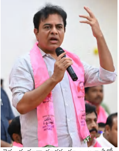
రైతులకు కూడా దూరమయ్యాయి. అలా ఏదో ఒక కారణంతో ఆయా వర్గాల ఓటర్లకు దూరమయ్యామని కేటిఆర్ తెలిపారు. ఎన్నో ఏండ్లగా ఉన్న ఫోరొసినీ భూకాశ్రి తరచిని కొట్టాం. ఫోరొసినీ కాంగ్రెస్ ప్రోమామనని ప్రజలకు చెప్పడంలో విఫలమయ్యాయి. నల్లగొండ జిల్లాకు పదేండ్లలో మూడు మెడికల్ కాలేజీలు ఇచ్చామని చెప్పడంలో విఫలమయ్యాయి. పెంబెలెండ్ల మన నాయకుడు కాదు.. తప్ప ప్రజలది కాదు. కేసిఆర్ మనల్ని నమ్ముకున్నాడు. మనమేమో ప్రజలకు చెప్పడంలో విఫలమయ్యాయి. ప్రజలేమో అబద్ధాలకు మోసపోయారు. పదేండ్ల నిజం ముందు ఈ వంద రోజుల అబద్ధం ప్రజలకు ఇవాళ కనబడుతుంది. ఏ ఊరికి మన నాయకులు పోయినా ఇల్లు అయితే అనుకోలేదు. ఇంత మోసం జరుగుతుంది అనుకోలేదు. ఇవాళ ప్రజలు బాధపడుతున్నారు. కేసిఆర్ సార్ మళ్లీ నువ్వు రావాలి. నువ్వన్నప్పుడే మంచిగరి బతికినం అని ఓ రైతు కన్నీరు పెట్టుకున్నా వీడియో నోషల్ మీడియాలో వైరల్ అయింది. కాంగ్రెస్ పాలన ప్రజలకు అర్థమైంది.. మనకు అర్థం కావాలి. మనం గట్టిగా పని చేస్తే ఫలితం వస్తుంది. 2018లో జిల్లా మొత్తంలో 12కి 11 గెలిచాం. నల్లగొండ పార్లమెంట్ లో 6 గెలిచాం. కానీ పార్లమెంట్ ఎన్నికల్లో నల్లగొండ, భువనగిరి స్థానాల్లో ఉడిపోయాం. ఇప్పుడు 11 సీట్లు గెలిచిన కాంగ్రెస్ పార్టీ ఈ రెండు ఎపిని నిరూపించవచ్చు. ఎందుకు ఉడిపో అలోటిటి పని చేయండి.. బీజేపీ, కాంగ్రెస్ రాజకీయాలను ప్రజలను సునిశితంగా గమనిస్తున్నారని అని కేటిఆర్ తెలిపారు.

సీట్లు గెలుస్తామన్న విశ్వసంతో ఉన్నాం. కానీ ఫలితాలు దానికి భిన్నంగా వచ్చాయిన్నారు. మన మిత్రుడు భూకా శాస్త్రి అసెంబ్లీ ఎన్నికల్లో ఉడిపోయిన తర్వాత దాదాపు 45 నియోజకవర్గాల్లో ఓటుపేట్ చేసుకున్నామని 20 మంది నిర్దూర్ణలతో సర్వే చేయించారు. ఆ సర్వేలో ఈ విషయాల వెలుగులోకి వచ్చాయని కేటిఆర్ తెలిపారు. మనం తప్పకుండా పార్టీ కుటుంబ సభ్యులుగా కేసిఆర్ బిడ్డలుగా ఆత్మ విమర్శ చేసుకోవాలి. మొన్న జరిగిన పాఠశాల పార్కమెంట్ ఎన్నికల్లో జరగకూడదు. పని చేసుకుంటూ వెళ్లిపోయాం.. కానీ ప్రభుత్వం చేసిన మంచి పనులను ప్రజల్లోకి తీసుకోకలేదు. ఎందుకంటే బీఆర్ఎస్ పాలనలో ఒక లక్షా 60 వేల 283 మంది పిల్లలకు ప్రభుత్వ ఉద్యోగాలు ఇచ్చాం. ఈ దేశంలో ఈ పదేండ్లలో ఏ రాష్ట్రంలో కూడా ఇన్ని ఉద్యోగాలు ఇవ్వలేదు. అంటే దేశంలోనే అత్యధికంగా ఉద్యోగాల భర్తీ చేసే కూడా కాదు మనను గెలుచుకోవడంలో విఫలమైతే మనకు గెలుపు ఉన్నట్టే. అంటే దేశంలోనే అత్యధికంగా ఉద్యోగాల భర్తీ చేసే కూడా కాదు ఇవ్వలేదు. పరీక్ష పెట్టలేదు. ఈ అబద్ధాలు మన ప్రజలు, యువతకు వివరించాలి. మనం ఉద్యోగాల్ని కూడా చెప్పుకోలేక పోయాం. అయితే లంబాడీ తండ్రిలోని కొంతమంది నిరుద్యోగులు తమకు ఉద్యోగాలు రాలేదు చెప్పారు. పెన్షన్లకు ఆశోపడి ఓటు వేయకండి.. తమకు ఉద్యోగాలు వస్తే తామే అంతకు ఎక్కువ ఇస్తామని చెప్పి వృద్ధుల కాళ్లు మొక్కి నిరుద్యోగులు ఓట్లు వేయించారు. మరి లక్షా 60 వేల ఉద్యోగాలు ఇచ్చినట్టు చెప్పడంలో విఫలమయ్యారు. ఇక గృహంక్తి అనే పధకం ఎన్ని కలకు ఏడాది ముందే అమలు చేసి ఉంటే.. ఓట్లు పడేవి అని విద్యార్థులు పేర్కొన్నట్టు సర్వేలో తేలిట్లు కేటిఆర్ చెప్పారు.