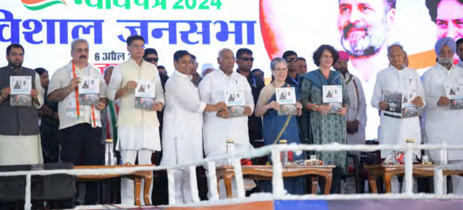
కార్పస్ ఖర్చే, రాహుల్ గాంధీ చట్టాన్ని ధర్మలో ప్రకటించారని, ఈ ఎన్నికలు అత్యంత కీలకమైన ఎన్నికలని అన్నారు. డిజైన్ ముఖ్యమంత్రి అరవింద్ కేజ్రీవల్, జారావద్ మాజీ సీఎం హేమంత్ సోరెన్ లను ఈడీ అరెస్టు చేయడాన్ని పార్టీ జాతీయ ప్రధాన కార్యదర్శి ప్రియాంక గాంధీ ప్రస్తావించి, కేంద్రంలోని బీజేపీ హయాంలో విపక్షాలు దాడులకు గురవుతున్నాయని ఆరోపించారు. ప్రతి రాష్ట్రంలోనూ నిరుద్యోగం, ప్రవృత్తిలంపణ తాకా సాయాకీ చేరుకున్నాయని, రైతులు, పేదల గోడు విన్నా నాడుదే లేదని ఆక్షేపించారు. కాంగ్రెస్ పార్టీ తమ మేనిఫెస్టోకు 'స్వాయం పాత్ర' అనే పేరు పెట్టారని, ఇది ఎంతమాత్రం ఎన్నికల తర్వాత మరిచిపోయే ప్రకటనల జాబితా ఎంతమాత్రం కాదని, న్యాయం కావాలని కోరుకుంటున్న దేశ ప్రజల వాణి అని అన్నారు.

మాట్లాడుతూ, తనను తాను ఒక గొప్పవ్యక్తిగా మోడి భావించుకుంటూ దేశ గౌరవాన్ని, ప్రజాస్వామ్యానికి తూట్లు పొడుస్తున్నారని అన్నారు. బీజేపీలో చేరాలని విపక్ష నేతలను బెదిరిస్తున్నారని ఈరోజు దేశ ప్రజాస్వామ్యం ప్రమాదంలో పడిందని అన్నారు. రాజ్యాంగాన్ని మార్చేందుకు కుట్రలు జరుగుతున్నాయని, ఇదంతా నియంతృత్వమేనని, దానికి కలిసికట్టుగా గుణపాఠం చెప్పాలని కోరారు. కాంగ్రెస్ సీనియర్ నేత సచిన్ పైలెల్ మాట్లాడుతూ, ఈసారి ఎన్నికలు ఎంతో నిర్భయత్వక ఎన్నికలని అన్నారు. రెండు సిద్ధాంతాలకు మధ్య జరుగుతున్న ఎన్నికలని చెప్పారు. రాజ్యాంగాన్ని బలహీనపరచడమే కేంద్ర ప్రభుత్వ విధానమని అన్నారు. రైతులకు కనీసమద్దతు ధర కల్పిస్తామని తొలిసారిగా మల్లి