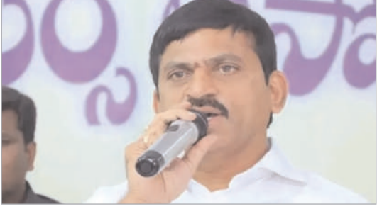
చేస్తామని మంత్రి స్పష్టం చేశారు. సాగర్ జలాల్తో ఈ ప్రాంత చెరువులు, కుంటలును నింపి త్రాగునీటి ఇబ్బందులను

ఖమ్మం జిల్లా, ఏప్రిల్ 8: తెలంగాణ రాష్ట్రంలో కాంగ్రెస్ ప్రభుత్వం రైతు సంక్షేమ మే ధ్యేయంగా పనిచేస్తుందని రెవెన్యూ శాఖ మంత్రి పొంగులేటి శ్రీనివాస్ రెడ్డి అన్నారు. సోమవారం వైరా నియోజకవర్గ కేంద్రంలో మంత్రి పర్యటించారు. ఈ సందర్భంగా పొంగులేటి మాట్లాడుతూ.. కేసీఆర్ నిర్మించిన కాలేజీలకు ప్రాజెక్టు దెబ్బతిన్నదని.. ఆ పరిస్థితుల్లో నీటిని మొత్తం వేస్తే గా దిగువ ప్రాంతాలకు పదిలారన్నారు. ఖమ్మం బీఆర్ఎస్ ప్రభుత్వం.. కాంగ్రెస్ ప్రభుత్వం వల్లనే నీటి కొరత ఏర్పడిందని విమర్శిస్తున్నారని మండిపడ్డారు. రైతులను రెచ్చగొట్టేందుకు సానుభూతి పొందేందుకు కేసీఆర్ సలీస్తున్నారని.. రైతాంగం అర్థం చేసుకోవాలని కోరారు. రాష్ట్రంలో నీటి కొరత తీకుండా