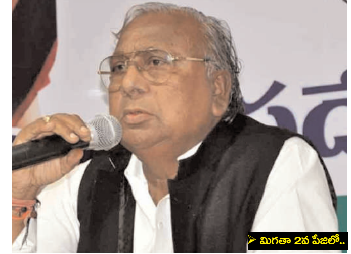
> మిగతా 2వ పేజీలో..