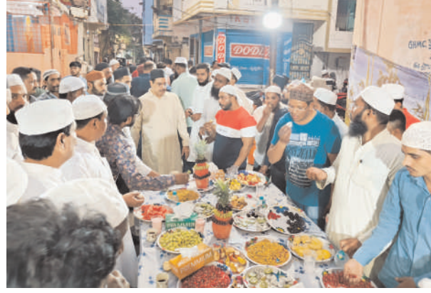
పరిధిలోని జామా మసీద్ ముఖ్య అతిథు లుగా హాజరయ్యారు. నియోజకవర్గం కాంగ్రెస్ పార్టీ ఇన్చార్జి రంజాన్ సందర్భంగా ఉపవాసం ఉన్న