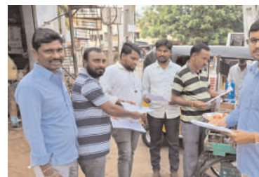
ట్లాడే వారి గొంతు నొక్కడం మనం చూస్తున్నాము. కాబట్టి, రాజ్యాంగ స్ఫూర్తికి విరుద్ధంగా ప్రజల మధ్య అనేక రకాల విద్యేషాలను సృష్టించే రాజకీయ పార్టీలను ప్రజలు ఆదరించకూడదని విజ్ఞప్తి చేస్తున్నాం. రాజ్యాంగాన్ని, ప్రజలను గౌరవించే పార్టీలను గెలిపించాలని కోరుతున్నాం.

జమ్మికుంట ఏప్రిల్ 7 (నినాదం స్పృష్): మే13న జరుగునున్న పార్లమెంట్ ఎన్నికల్లో “మన ఓటును ప్రజలనూ, ప్రజాస్వామ్యాన్ని, రాజ్యాంగాన్ని గౌరవించే పార్టీకే వేద్దాం” అనే స్లోగన్ తో మానవ హక్కుల వేదిక ఆధ్వర్యంలో జమ్మికుంట పట్టణంలో కరపత్రాల పంపిణీ చేశారు. దేశంలో రోజు రోజుకూ విద్యేష రాజకీయాలు పెరిగిపోతున్నాయి. రాజ్యాంగం అన్నా, ప్రజల హక్కులన్నా పాలకులకు కనీస గౌరవం లేని పరిపాలన కేంద్రంలో కొనసాగుతున్నది. నిరుద్యోగం, పేదరికం, దేశ ఆర్థిక స్థితి గతులు రోజు రోజుకూ దిగజారిపోతున్నాయి. దేశంలో ప్రత్యామ్నాయ రాజకీయ పార్టీలు లేకుండా చేయడం, మత విద్యేషాలు రెచ్చగొట్టడం, హక్కుల గురించి మా