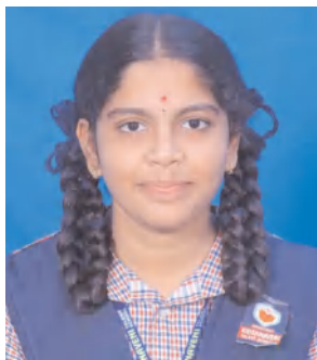
మంచిర్యాల జిల్లా ప్రతినిధి ఏప్రిల్ 30(నినాదం స్కూల్):

10వ తరగతి ఫలితాల్లో మంచి ర్యాంకులు జిల్లా బెల్లంపల్లి పట్టణంలోని కృష్ణవేణి టాలెంట్ స్కూల్ విద్యార్థులు ప్రభంజనం సృష్టించారు. మంగళవారం తెలంగాణ రాష్ట్ర ప్రభుత్వం ప్రకటించిన 10వ తరగతి 2023-24 పరీక్షా ఫలితాల్లో కృష్ణవేణి టాలెంట్ స్కూల్ విద్యార్థులు అత్యుత్తమ ప్రతిభ కనబ