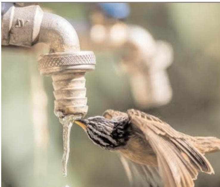
ఉంటుందని ప్రత్యక్షంగా చూడలేమని పలువురు జంతు ప్రేమికులు అంటున్నారు. కొన్ని కొన్ని గ్రామాలలో ప్రజలను చూసి