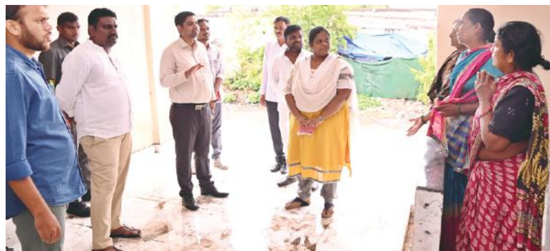
ప్రజాపాలన కార్యక్రమంలో దరఖాస్తు చేసుకున్న వారిలో అర్బులైన లబ్ధిదారులకు పథకాల అందేవిధంగా అధికారులు ప్రతి దరఖాస్తు, అభివృద్ధి వివరాలను క్షుణ్ణంగా పరిశీలించి

జిల్లా కలెక్టర్ కుమార్ దీపక్ మంచిర్యాల జిల్లా ప్రతినిధి జూన్ 20 (నినాదం స్పెషల్): ప్రజా సంక్షేమం, అభివృద్ధి కోసం తెలంగాణ ప్రభుత్వం చేపట్టే పథకాల ఫలాలు అర్బులైన ప్రతి ఒక్కరికీ అందించేందుకు జిల్లా అధికార యంత్రాంగం సమస్యయంతో పని చేయాలని జిల్లా కలెక్టర్ కుమార్ దీపక్ అన్నారు. గురువారం జిల్లాలోని బెల్లంపల్లి పట్టణంలోని మున్సిపల్ కార్యాలయాన్ని ఆకస్మిక తనిఖీ చేసి కార్యాలయంలోని వివిధ విభాగాలు, ప్రజాపాలన కౌంటర్లను ఆయన పరిశీలించి మున్సిపల్ అధికారులతో సమీక్షా సమావేశం నిర్వహించారు. ఈ సందర్భంగా జిల్లా కలెక్టర్ స్థానిక సిబ్బందితో మాట్లాడుతూ ప్రభుత్వం ప్రవేశపెట్టిన