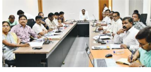
నుండి రోజుకు 100 దరఖాస్తులు పరిష్కరించి కలెక్టర్ లాగిన్ కు పంపించాలని ఆదేశించారు. నిర్లక్ష్యం చేస్తే చర్యలు తీసుకుంటామని హెచ్చరించారు. అప్రోచ్ పద్ధతి, తహశీల్దార్లు తదితరులు పాల్గొన్నారు.

జిల్లా కలెక్టర్ తేజస్ నందలాల పవర్ వనపర్తి జిల్లా ప్రతినిధి జూన్ 14 (నినాదం స్పూన్): దరఖాస్తులు యుద్ధ ప్రాతిపదికన పరిష్కరించేందుకు చర్యలు తీసుకోవాలని జిల్లా కలెక్టర్ తేజస్ నందలాల పవర్ ఆదేశించారు. శుక్రవారం కలెక్టరేట్ కాన్ఫరెన్స్ హాల్లో ధరఖాస్తులపై సమీక్ష నిర్వహించారు. జిల్లాలో 4298 దరఖాస్తులు పెండింగ్ లో ఉన్నాయని తహశీల్దార్లు తమలాగిన్లో ఉన్న వాటిని క్షేత్రస్థాయిలో పరిశీలించి వెంటనే పరిష్కరించాలని తహశీల్దార్లను ఆదేశించారు. పరిశీలన పూర్తి అయిన వెంటనే ఆన్లైన్లో అప్లోడ్ చేసి ఫిజికల్ ఫార్ముల అప్లోడ్ పంపించాలని సూచించారు. రోజుకు మండలం నుండి కనీసం 10 దరఖాస్తులు పరిష్కారం చేసి అప్లోడ్ లాగిన్ కు పంపించాలన్నారు. ముఖ్య మంత్రి గ్రీన్ ఫీల్డ్లు ఎప్పటికప్పుడు పరిష్కరించాలని ఆదేశించారు. అప్రోచ్ లాగిన్