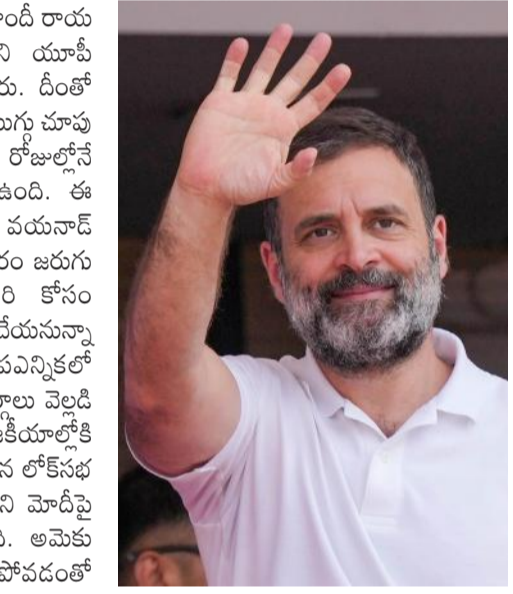
అంతా అనుకున్నారు. కానీ అక్కడ రాహుల్ పోటీచేసి విజయం సాధించారు. అయితే కేరళలో అసెంబ్లీ ఎన్నికల నేపథ్యంలో రాహుల్.. వయనాడ్ ను అట్టిపెట్టుకుని రాయలబరేలి స్థానానికి రాజీనామా చేస్తారనే ప్రచారమూ జరిగింది. అయితే ఇప్పుడు వయనాడ్ పై ఆయన పదివిడతలారని చర్రు జరుగుతున్నది. దీంతో ఇక్కడ ప్రియాంకను నిలబెట్టి దక్షిణాదిలో మరంతగా ప్రచారం చేయాలని చూస్తున్నారు.

జరిగిన సార్వత్రిక ఎన్నికల్లో రాహుల్ గాంధీ అనివార్యం. అందుకే.. రాహుల్ గాంధీ రాయల బరేలి స్థానంలోనే కొనసాగాలని యూపీ కాంగ్రెస్ నేతలు పట్టుబడుతున్నారు. దీంతో రాహుల్ సైతం రాయలబరేలి వైపు మొగ్గు చూపుతున్నారు. దీనిపై ఒకటి రెండు రోజుల్లోనే నిర్ణయం వెలుపడే అవకాశం ఉంది. ఈ క్రమంలో తాజాగా ప్రయాంకా వయనాడ్ నుంచి బరిలోకి దిగుతారని ప్రచారం జరుగుతున్నది. రాహుల్ తన సోదరి కోసం వయనాడ్ స్థానానికి రాజీనామా చేయనున్నారని, దీంతో అక్కడ జరిగే ఉపఎన్నికల్లో ప్రయాంక పోటీచేస్తారని పార్టీ వర్గాలు వెల్లడించాయి. 2019లో ప్రత్యక్ష రాజకీయాల్లోకి వచ్చిన ప్రయాంక.. అప్పుడు జరిగిన లోక్ సభ ఎన్నికల్లో వారణాసి నుంచి ప్రధాని మోదీపై పోటీచేస్తారని ప్రచారం జరిగింది. అమెకు కాంగ్రెస్ పార్టీ టికెట్ ఇవ్వకపోవడంతో అదంతా ఒట్టి ప్రచారమేనని తేలిపోయింది. తర్వాత 2022లో జరిగిన ఉత్తరప్రదేశ్ అసెంబ్లీ ఎన్నికల్లో ప్రచార బాధ్యతలను తన భుజాలపై వేసుకున్నారు. విస్తృతంగా ప్రచారం నిర్వహించారు. తానే ముఖ్యమంత్రి అభ్యర్థించుటా పేర్కొన్నారు కూడా. కానీ, తర్వాత ఎమ్మెల్యేల మోటాలను వెనక్కి తీసుకున్న ఆమె.. ఎన్నికల్లో పోటీచేయడం లేదని ప్రకటించారు. ఇక తాజాగా జరిగిన లోక్ సభ ఎన్నికల్లో తన తల్లి సోనియా గాంధీ ఇన్ఫాట్ ప్రాతినిధ్యం వహించిన రాయలబరేలి నుంచి పోటీచేస్తారని