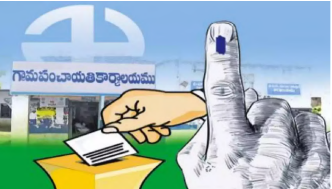
నిక నేతలు ప్రయత్నాలు చేస్తున్నారు. ప్రధాన మంత్రి సరేంద్ర మోదీ పాలనపై వివరిస్తూ బిజెపి నేతలు కార్యక్రమాలలో పాల్గొంటున్నారు. కేంద్ర ప్రభుత్వ పథకాలను, సంక్షేమ కార్యక్రమాలను ప్రజలకు వివరిస్తున్నారు. గెలిచిన వారు ఎపిలో ప్రజలను నేరుగా కలుసుకునేలా కార్యక్రమాలను ఏర్పాటు చేసుకుంటున్నారు.

సార్వత్రిక ఎన్నికల ఫలితం ముగియడంతో ఇరు తెలుగు రాష్ట్రాల్లో మళ్ళీ రాజకీయ సందడి మొదలయ్యింది. వచ్చేది స్థానిక ఎన్నికల కాలం కావడంతో ఛోటామోటా నేతలు ఇప్పటికే హడావిడి చేస్తున్నారు. ఎపిలో కొత్తగా ఎంపికయిన ఎమ్మెల్యేలు కూడా గ్రామాల బాట పడుతున్నారు. ప్రజలను కలిసి కృతజ్ఞతలు తెలియచేస్తున్నారు. దీంతో తెలంగాణలో పాటు ఎపిలోనూ రాజకీయ సందడి మొదలయ్యింది. ఎన్నికల సందర్భంగా గ్రామాల్లో రాజకీయ పార్టీల సందడి జోరుగా కనిపించింది. అయితే అది ప్రచారమే కావడం వల్ల ఇప్పుడు అసలు సీనియర్లు రాజకీయం ఉండబోతున్నది. ఇచ్చిన హామీల మేరకు ప్రజలు కూడా నిలదీసే పరిస్థితి కనిపిస్తోంది. తెలంగాణలో బిజెపి, కాంగ్రెస్, ఎంపిలు, ఎమ్మెల్యేలు ప్రజలకు దన్నువారి కార్యక్రమాలలో ఉన్నారు. జిల్లాల్లో ప్రజాక్షేత్రంలోకి వెళ్లి బలోపేతం కావడానికి ప్రయత్నాలు చేస్తున్నారు. ఒక్కో పార్టీ ఒక్కో పేరిట ప్రజల్లోకి వెళ్లి తమ వాణిని వినిపిస్తున్నాయి. తెలంగాణ మొత్తం అభివృద్ధి చెందిందన్న ప్రచారంతో ప్రజలను బురిడీ కొట్టించిన బిఆర్ఎస్ నేతలు గ్రామాల్లో తర్రెత్తుకునే పరిస్థితి లేదు. ఎమ్మెల్యేలు జనంలో ఉండాలన్న అధికార పక్షం ఆదేశాన్ని తూచా తప్పకుండా పాటిస్తున్నారు. తమ ప్రభుత్వాల పాలన, పార్టీ కార్యక్రమాలు, లక్ష్యాలు, పనితీరును వివరించడా