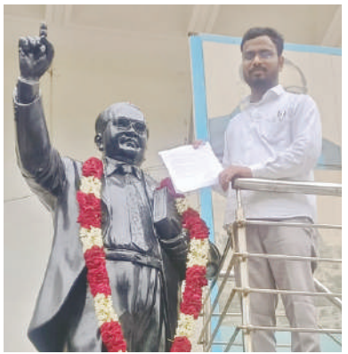
మధ్యం దుకాణంపై కూడా సంబంధిత అధికారులు చర్యలు తీసుకోవాలన్నారు.