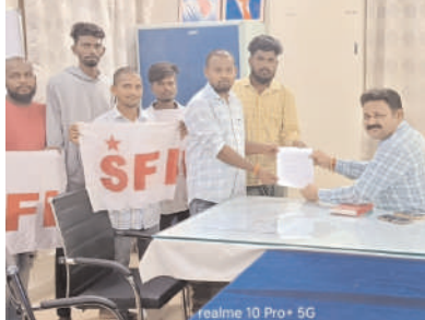
కస్తూర్బా గాంధీ పాఠశాలలో ఎస్సీ ఎస్టీ బీసీ మైనార్టీ వర్గాలకు చెందిన 250 మంది విద్యార్థి