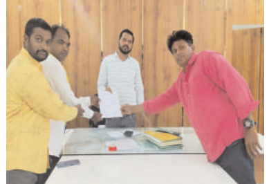
పాత జిమ్ శిథిలా వ్యవస్థలో ఉండగా కోసం