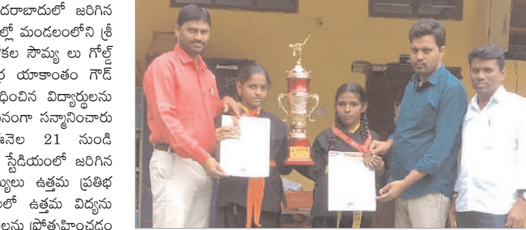
కార్యక్రమంలో ప్రాధికారం వారికి వివేకవర్ధని విద్యార్థులు.