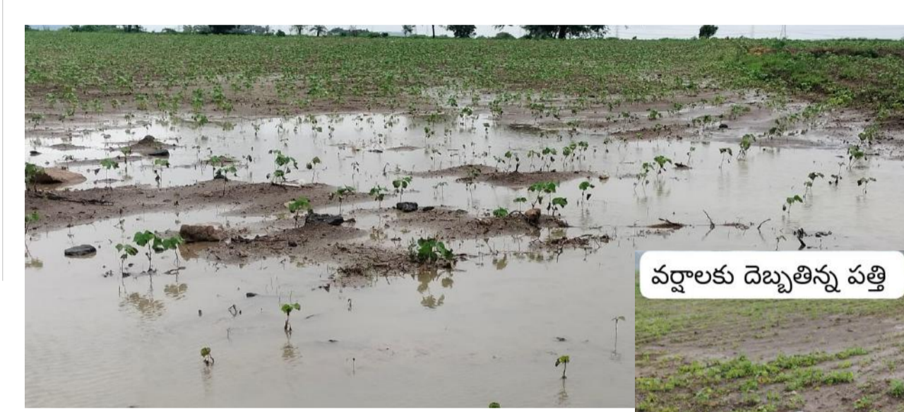
వర్షాలకు దెబ్బతిన్న పత్తి