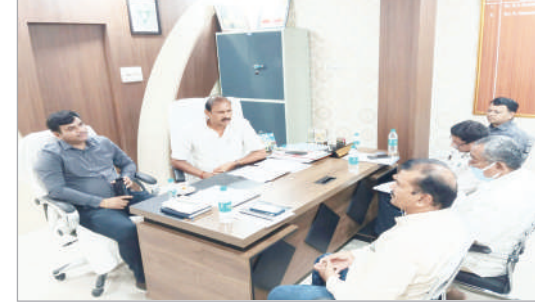
కరీంనగర్, ఆగస్టు 17 (నినాదం న్యూస్)