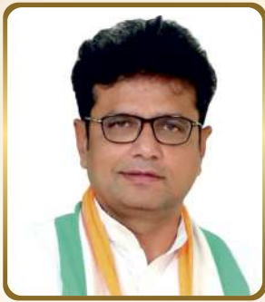
శ్రీ. దుద్దిల శ్రీధర్ బాబు గారు, ఐటీ, పరిశ్రమల శాఖ మంత్రి.