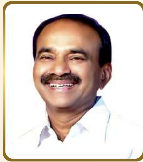
శ్రీ. ఈటెల రాజేందర్ గారు, ఎంపీ, మల్కాజ్ గిరి.