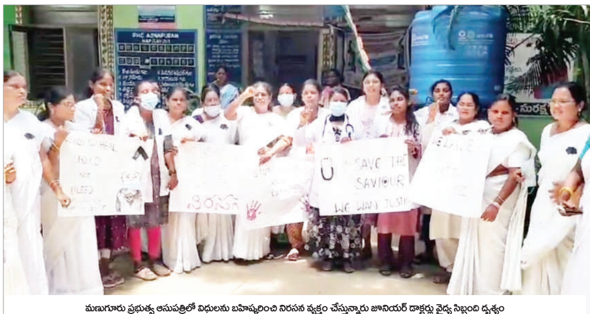
మణుగూరు ప్రభుత్వ ఆసుపత్రిలో విధులను బహిష్కరించి నిరసన వ్యక్తం చేస్తున్నారని జూనియర్ డాక్టర్లు వైద్య సిబ్బంది దృక్పథం

మణుగూరు ఆగస్టు 17 (నినాదం న్యూస్): ఇటీవల కలకత్తాలో మెడికల్ షీట్ విద్యార్థులపై సామాజిక అత్యాచారం చాత్య చేసిన సంఘటనను నిరసిస్తూ పినపాక నియోజకవర్గంలో మణుగూరు ఆస్పత్రి బయటపాక పినపాక కరకడగూడ మండలాల్లో ప్రభుత్వ వైద్యశాలలో జూనియర్ డాక్టర్లందరూ శనివారం విధులను బహిష్కరిస్తూ రోడ్డు ఎక్కి నిరసన తెలియజేశారు.