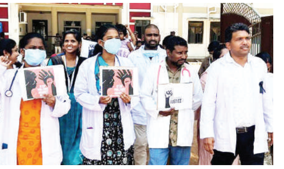
శివలింగాపురం ప్రభుత్వ వైద్యశాలలో విధులను బహిష్కరించి నిరసన వ్యక్తం చేస్తున్న జూనియర్ డాక్టర్లు వైద్య సిబ్బంది