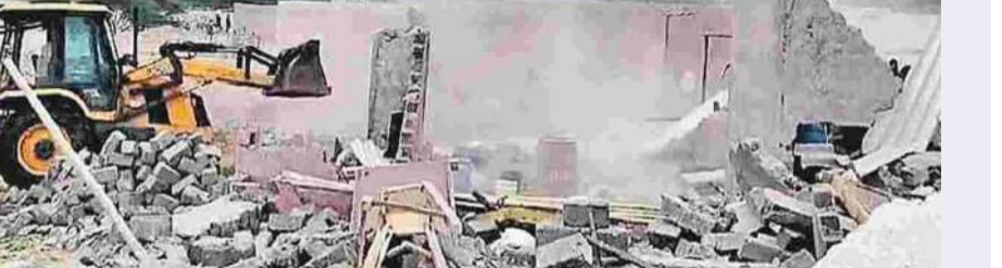
పరిధిలో అక్రమ నిర్మాణాలపై దృష్టి సారించారు బలీయా అధికారులు.. పాతబస్ లోని ప్రభుత్వ భూములను ఆక్రమించి నిర్మాణాలను బుధవారం ఆగస్టు 14, 2024 న తొలగించారు. బుధవారం ప్రభుత్వ భూమిలో నిర్మించిన అక్రమ కట్టడాలను హైద్రా అధికారులు తొలగించారు.

హైదరాబాద్ నగరంలోని అక్రమ నిర్మాణాలపై బలీయా అధికారుల కొరడా ఝుంకిపెట్టుతున్నారు. రోడ్డు, భల్లి పాత్ లపై నిర్మించిన అక్రమ కట్టడాలని కూల్చివేస్తున్నారు. గోశామహల్ నియోజకవర్గం పరిధిలోని జేగం బజార్ లో పుల్ పాత్ పై షెడ్ నిర్మించారు. దీంతో స్థానికులకు ఈ విషయాన్ని బలీయా అధికారుల దృష్టికి తీసుకెళ్లారు. స్థానికుల ఏర్పాటుతో అక్రమంగా నిర్మించిన షెడ్ ను క్రేన్ సహాయంతో తొలగించారు బలీయా అధికారులు. గత కొన్ని రోజులుగా హైదరాబాద్ సిటీలోపాటు ఊడలం