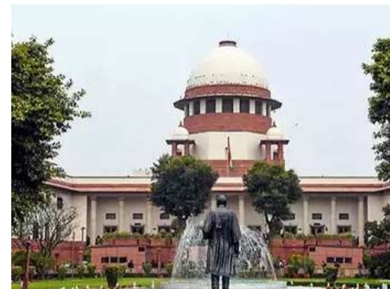
కేంద్రం, గనుల కంపెనీలు ఇవ్వాలని బకాయిలను రానున్న 12 ఏళ్లలో దశలవారిగా చెల్లించాలి.

ఖనిజ భూమిలు, గనులపై రాయల్టీ వాపస్ విషయంలో రాష్ట్రాలకు భారీ విజయం దక్కింది. 2005 నుంచి రాయల్టీ బకాయిలను కేంద్రం నుంచి రాష్ట్రాలకు కోరవచ్చని సుప్రీంకోర్టు స్పష్టం చేసింది. ఈ మేరకు బుధవారం కీలక తీర్పు వెలువరించింది. రాయల్టీపై ఇటీవల సర్వోన్నత న్యాయస్థానం ఇచ్చిన తీర్పును ఈ ఏడాది జూలై 25 నుంచే అమలు చేయాలన్న కేంద్రం అభ్యర్థనను సీజేబి జస్టిస్ డి.వై. చంద్రచౌదరి చేత్యత్వంలోని ధర్మాసనం తిరస్కరించింది.