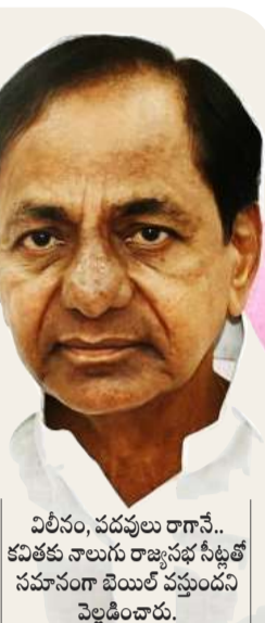
విలీనం, పదవులు రానే.. కవితకు నాలుగు రాజన్నప సీట్లతో సమానంగా బియిల్ వస్తుందని చెల్లడం వారు.

న్యూఢిల్లీ, నినాదం: బీఆర్ఎస్ పార్టీని బీజేపీలో విలీనం చేయడం తథ్యమని సీఎం రేవంత్ రెడ్డి సంచలన వ్యాఖ్యలు చేశారు. ఢిల్లీలో ఆయన మీడియాతో మాట్లాడుతూ.. తన వ్యాఖ్యలను బీఆర్ఎస్ నేతలు ఖండించినా.. అది ఎప్పటికీ జరుగి తీరుతుందని అన్నారు. విలీనం అయిన వెంటనే కేసీఆర్ కు గవర్నర్ పదవి, కేటీఆర్ కు కేంద్రమంత్రి పదవి వస్తుందని అన్నారు. రాష్ట్రంలో హారీష్ రావు ప్రతిపక్ష నేత అవుతారని అన్నారు. >2లో..