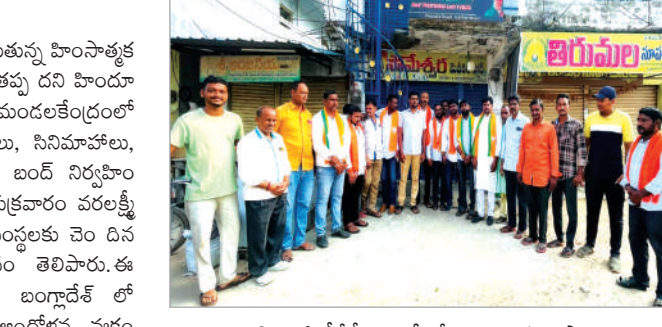
బంధువులు, బిజెపి, ఏ.పీ.పీ, మైనార్టీ క్రేజులు, వర్తక వ్యాపారులు స్వచ్ఛందంగా పాల్గొని హిందూ బక్ష్మవేదికలు.

బంగ్లాదేశ్ లో హిందువులను, హిందూదేవాలయ లపై జరుగుతున్న హింసాత్మక మారణకాండను ఆపకపోతే తగిన మూల్యం చెల్లించుకోక తప్ప దని హిందూ బక్ష్మవేదిక హెచ్చరించారు. శుక్రవారం సుల్తానాబాద్ మండలకేంద్రంలో స్వచ్ఛందంగా వర్తక, వాణిజ్య వ్యాపార సంస్థలు, హోటలలో, సినిమా హాలులు, ప్రభుత్వ ప్రైవేటు పాఠశాల లు, కళాశాలలు సంఘర్షణంగా బండ్ నిర్వహించారు. బంగ్లాదేశ్ హిందువులకు బాసటగా ఉం టామని శుక్రవారం వరలక్ష్మి వ్రతం వంద గ ఉన్న ఉదయం నుండి వ్యాపారులు, విద్యార్థులకు చెం దిన వారు స్వచ్ఛందంగా బండ్ నిర్వహించి సంఘీభావం తెలిపారు. ఈ సందర్భంగా హిందూ బక్ష్మవేదిక వారు మాట్లాడుతూ బంగ్లాదేశ్ లో హిందువులే లక్ష్యంగా దాడులు జరుగుతున్నాయని ఆందోళన వ్యక్తం చేశారు. ఈ దాడుల వె నకు ఎవరి హస్తం ఉండో విచారణ జరిపి చర్య లు తీసుకోవాలని డిమాండ్ చేశారు. ఈ బండ్ కార్యక్రమంలో హిందూ