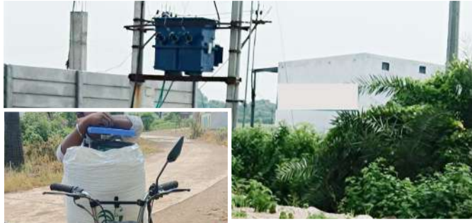
రాజన్న సిరిసిల్ల జిల్లా బోయస్ పబ్లిక్ ఓ రైస్ మిల్ కు తరలిస్తున్న రేషన్ బియ్యం పడటంతో ఇక్కడి ఇద్దరు ఖల్ నాయక్ లకు గిరాకీ మరింత పెరిగింది. దానికి అధికారుల అందడం దలూ తోడవుటంతో వీరి వ్యాపారం మూడు పువ్వులు అరుకాయల్లా సాగుతోంది. ఏదేమైనా పాపిపండ్లను పనిచేసే బంగారు పండ్లను తిన్నట్లు, ప్రభుత్వం పేదల కోసం కొట్టినట్లులు చెప్పిస్తుంటే వాటిలో 70 శాతం ఇలాంటి ఖల్ నాయక్ ల జేబుల్లోకి వెళుతున్నాయి. సర్కారు నిధులకు చిల్లు పడే ఇలాంటి దుర్మార్గానికి ముగింపు పాడకపోతే కాంగ్రెస్ ప్రజాపాలన అజానుపాలు కావటం తప్పదని పలువురు బావిస్తున్నారు.

రైల్వే టికెట్ లేని ప్రయాణీకుడు దొంగిలక్క బాబులను టిక్కెట్లు ఉంది జగిత్యాల జిల్లాలోని కొండూరు అధికారుల తీరు, అక్రమాలకు పాల్పడుతున్న వారిని అదుపుచేయ కపోగా అక్రమ దందాపై వార్తలు వస్తూ వుండటం వారి మామూలు పెంచేస్తున్నట్లు తెలిసింది. జిల్లాలోని కొడిమ్యాల, పూడూరు మల్లాల మొదలగు ప్రాంతాల్లో రాత్రిపగలు సాగుతున్న రేషన్ అక్రమ దందా ఆగుంటే.