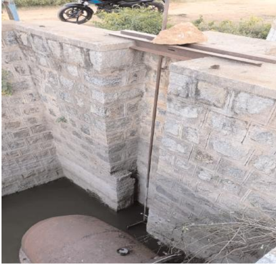
మునగాల, ఆగస్టు 21 (నినాదం న్యూస్):

మునగాల మండల కేంద్రం స్థానిక నాగార్జునసాగర్ ఎడమ కాలువ సమీపంలో ఉన్న ఫస్ట్ లిఫ్ట్ సమీపంలో రైతుల సాగునీటి కోసం కోసం ఏర్పాటుచేసిన తూమును బండు చేసి, పొలాలకు సాగునీటికి కొందరు అంతరాయం కలిగిస్తున్నారని బుధవారం నినాదం న్యూస్ కి తెలిపారు. ఈ సందర్భంగా వారు మాట్లాడుతూ... కేవలం ఈ తూము