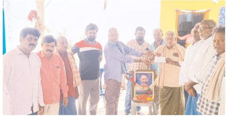
మునగాల, ఆగస్టు 21 (నినాదం న్యూస్):