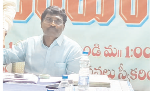
కారేపల్లి, ఆగస్టు 05 (నినాదం న్యూస్):