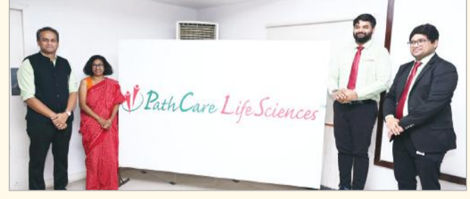
భైరాలాబాద్, సెప్టెంబర్ 6 నినాదం న్యూస్: