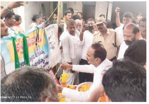
కారేపల్లి, సెప్టెంబర్ 06 (నినాదం న్యూస్):