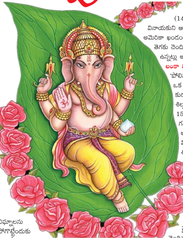
విఘ్నాలను పోగొట్టేందుకు ఒక దేవతను

(1492) హిందువులు అక్కడికి చేరాననీ, వినాయకుని ఆరాధించారని అభిప్రాయపడ్డారు. ఆమెరికా ఖండంలోని పెరా, మెక్సికోలో ఇంకా తెగకు చెందిన ఆదివాసులలో గణపతి ఆరాధన ఉన్నట్లు ఆధారాలు లభిస్తున్నాయి. లంకా ద్వీపంలో గణేశుడు... శ్రీలంకలోని 'పోలిస్వరువ' సమీపంలోని శివాలయంలోని ఒక స్తంభంపైన చతుర్భుజులు, చేతిలో కుదుమును కలిగి ఉన్న వినాయకుని శిల్పం ఉంది. కొలాంబోలో సుమారు 150 కిలోమీటర్ల దూరంలో 'కలర్ గమ్'లో శ్రీ సుబ్రహ్మణ్యస్వామి ఆలయం ఉంది. ఈ ఆలయంలో వినాయకునికి ప్రత్యేక సన్నిధి ఉంది. ఈ వినాయకుడిని హిందువులతో పాటు మహమ్మదీయులు, క్రైస్తవులు కూడా పూజించడం విశేషం. వినుగుల దొర... చైనా భాషలో వినాయకుడిని 'కువాన్ సి-ఆయన్' అని పిలుస్తారు. ఇక్కడి శాసనాల్లో వినాయకుని వినుగుల దొరగా పేర్కొన్నారు. చైనాలో క్రీ.శ. 531 ప్రాంతానికి చెందిన వినాయకుని శిల్పం ఒకటి 'కుంగ్-హియన్' అలయ గోడలపై లభించింది. అలాగే 'కుని హువాన్' గుహలోని గోడలపై వినాయకుని విగ్రహం కనిపిస్తుంది. వీటిలో వినాయకుడు ఒక చేతిలో కమలం, మరో చేత 'చింతామణి' ని ధరించి ఉన్నాడు. అలాగే ఇద్దరు వినాయకులు ఒకరినొకరు కౌగిలించుకున్న రూపంలోని ప్రతిమ కూడా లభించింది. ఈ కవల వినాయక ప్రతిమ జపాన్ వినాయక ప్రతిమను పోలి ఉన్నది. బొద్దలో వినాయకుడు... గణపతి ఆరాధన 10వ శతాబ్దం నాటికి బాగా విస్తృతమైంది తెలుస్తోంది. 'హిరంబ గణపతి'ని నేపాల్ లో ఆరాధిస్తారు. ఇక్కడ అనేక కాంస్య విగ్రహాలు లభ్యమయ్యాయి. ఇక్కడ వినాయకునికి మూషికవాహనంతో పాటు సింహం కూడా వాహనంగా కనిపిస్తుంది. కొన్ని విగ్రహాల్లో ఒక కాలి కింద సింహం, మరో కాలి కింద మూషికం ఉండగా, మరికొన్నింటిలో రెండు కాళ్ళ క్రింద రెండు ఎలుకలు ఉండడం కనిపిస్తుంది. కాగా, ఈ దేశంలో