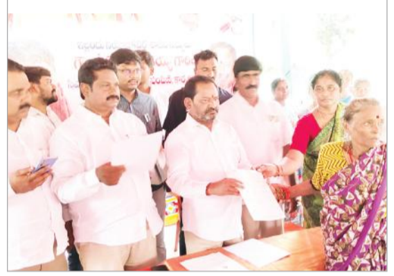
ఇల్లందు, సెప్టెంబర్ 6 (నినాదం న్యూస్):