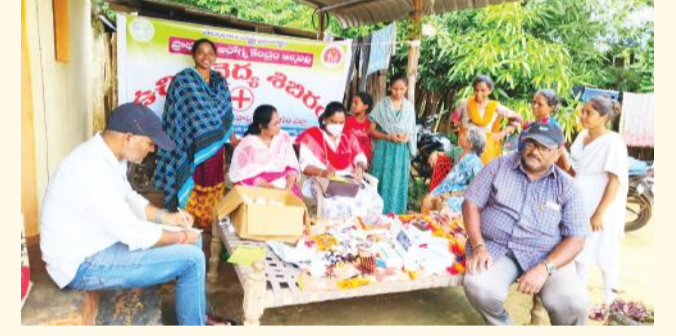
అక్షపల్లి సెప్టెంబర్ 6 నినాదం న్యూస్