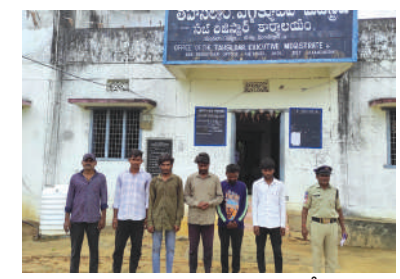
సమాచారం అందించాలని ఆయన కోరారు.