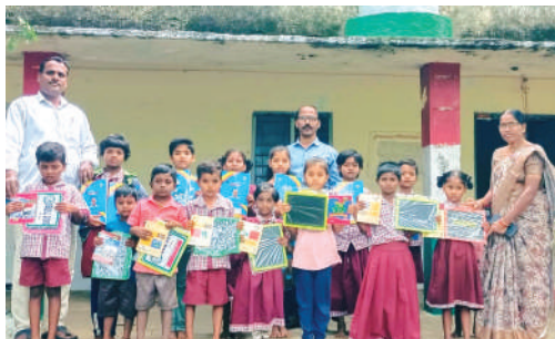
మాట్లాడుతూ... ప్రభుత్వ పాఠశాలలో నేర్చుకున్న చదువు వెలకట్టలేనిదని, ప్రాథమిక విద్యా బలోపేతం చేస్తే విద్యార్థులు భవిష్యత్తులో ఎంతో చక్కగా రాణించగలుగుతారని, ప్రభుత్వ