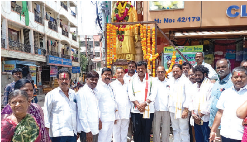
కుత్బుల్లాపూర్, సెప్టెంబర్ 27 (నినాదం న్యూస్) : స్వాతంత్ర్య సమరయోధుడు తెలంగాణ కోసం సర్వస్వం దార పోసిన త్యాగశీలి ఆచార్య కొండా లక్ష్మణ్ బాపూజీ జయంతి వేడుకలలో