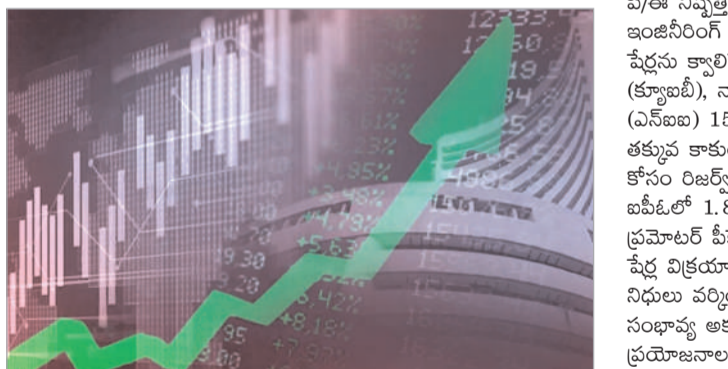
ఐపీఓలో పెట్టుబడికి సంబంధించిన విషయాలను ఓ సారి తెలుసుకుందాం. గరుడ కన్స్ట్రక్షన్ షేర్ ధర ఈక్విటీ షేర్ ముఖ

భారతదేశంలో పెట్టుబడిదారుల ఆలోచనలు ఇటీవల కాలంలో పెట్టుబడిదారుల ఆలోచనలు మారాయి. పెరుగుతున్న ఆర్థిక అక్షరాస్యత నేపథ్యంలో స్థిరమైన ఆదాయ వర్షాల్లో కాకుండా స్టాక్ మార్కెట్ లో పెట్టుబడి పెట్టడానికి ఆసక్తి చూపుతున్నారు. ఇలాంటి వారు కొత్తగా వచ్చిన వలు కంపెనీల ఐపీఓల్లో తక్కువ పెట్టుబడితో అధిక లాభం ఆర్జించవచ్చని ఆర్థిక నిపుణులు చెబుతున్నారు. తాజాగా ప్రముఖ కంపెనీ అయిన గరుడ కన్స్ట్రక్షన్ అండ్ ఇంజనీరింగ్ ఐపీఓ ప్రైవేట్ లిమిటెడ్ రూ.5 ముఖ విలువ కలిగిన ఒక్కో షేర్ రూ.92 నుంచి రూ. 95 వరకు నిర్ణయించారు. గరుడ కన్స్ట్రక్షన్ ఐపీఓ, అక్టోబర్ 1 నుంచి కొనుగోలుదారులకు అందుబాటులో ఉంది. ఈ ఐపీఓ కొనుగోలు అక్టోబర్ 10 న ముగుస్తుంది. గరుడ కన్స్ట్రక్షన్ ఐపీఓ కోసం యాంకర్ ఇన్వెస్టర్లు కేటాయింపు అక్టోబర్ 7 న సమావారం జరగనుంది. ఈ నేపథ్యంలో గరుడ