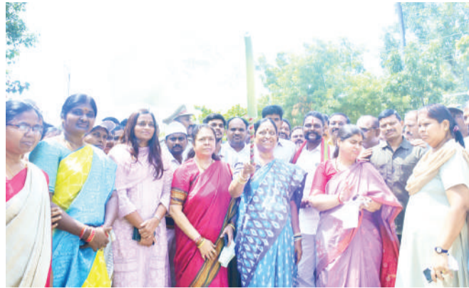
వరంగల్ జిల్లా ప్రతినిధి అక్టోబర్ 03 (నినాదం న్యూస్)

● ఫైలెట్ ప్రాజెక్ట్ సర్వేను ప్రారంభించిన మంత్రి కొండా