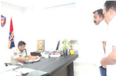
ఆసిఫాబాద్ అక్టోబర్ 07(నినాదం స్పూస్ ) కొమురం భీమ్ ఆసిఫాబాద్ జిల్లా లో సోమవారం రోజున జిల్లా పోలీస్ కార్యాలయంలో