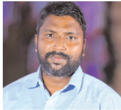
కుటుంబంలో రుణం ఎంతమంది తీసుకున్న సరే