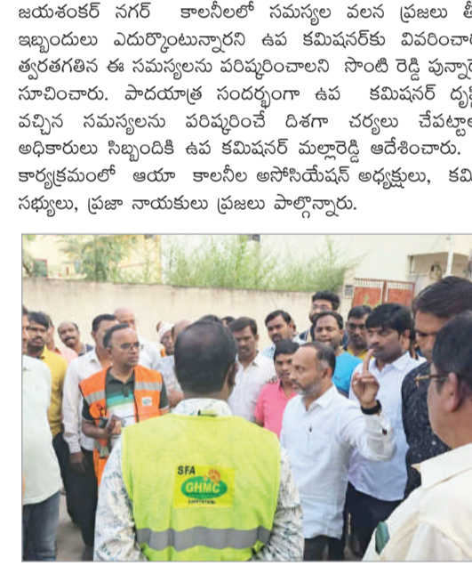
జయశంకర్ నగర్ కాలనీలో సమస్యల పరిష్కారం కోసం డి.ఎం.సీ. రాష్ట్ర ప్రధాన కార్యదర్శి కుశాభిషేకం నియోజకవర్గ కాంగ్రెస్ పార్టీ నాయకులు మున్సిపల్ అధికారులతో కలిసి మంగళవారం నాడు పాదయాత్ర నిర్వహించారు.