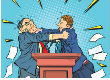
దూషించ గా అప్పుడే అటువైపుగా వెళ్తున్న అదే కులానికి చెందిన వ్యక్తులు ఆ ప్రజాప్రతినిధిని నిలదీసినట్లు సమాచారం. నీకు మా ఏరియా ప్రతినిధి స్టేషన్ కు వెళ్తే అతనితో మాట్లాడుకోవాలి తప్ప మా కులాన్ని దూషించడం ఎంతవరకు నబబి అని

ప్రజాప్రతినిధిని ప్రశ్నించగా ఇరువర్గాల మధ్య గొడవ చిలికి చిలికి గాలి వానల తయారైందిని ఒక సందర్భంలో స్వల్ప ఉద్రిక్తత ఏర్పడి కొట్టుకున్నట్లు ఆ కాలనీ ప్రజలు తెలుపుతున్నారు. ఈ విషయాన్ని ఎవరో 100 నెంబర్ కు ఫోన్ చేసి ఫిర్యాదు చేయగా పోలీసులు వచ్చి ఇరువర్గాలను చెదరగొట్టి పోలీస్ స్టేషన్ కు రమ్మని తెలిపినట్లు సమాచారం. రాత్రి జరిగిన ఈ ఘటనను ప్రజలు చీదరించు కుంటున్నారని ప్రజా సమస్యలపై పోరాడాలని ప్రజాప్రతినిధులు ఇలా దిగజారి ప్రవర్తించడం సిగ్గుచేటని అంటున్నారు. బయట మాత్రం చేరువేరు పార్టీ ప్రజాప్రతినిధులుగా కొనసాగుతూ రాత్రి అయితే మాత్రం అందరూ ఒకే చోట చేరి దావతులు చేసుకుంటున్నట్లు ఇప్పటికే వుక్కా షికార్లు కొడుతున్నాయి. ఈ విషయంపై పట్టణ సిబిసి వివరణ కోరగా బుధవారం ఏచారణ జరిపి వివరాలు అందజేస్తానని తెలిపారు.