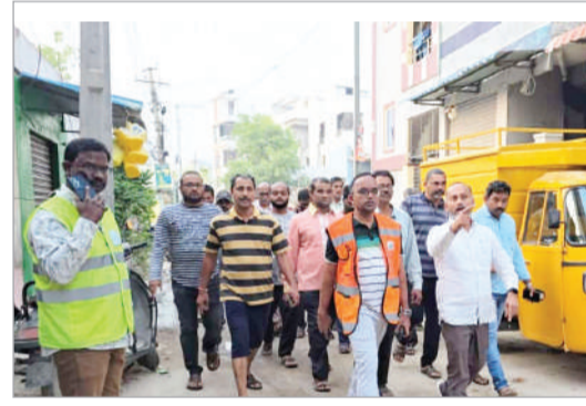
కుశాభిషేకం, అక్టోబర్ 29 (నినాదం న్యూస్)