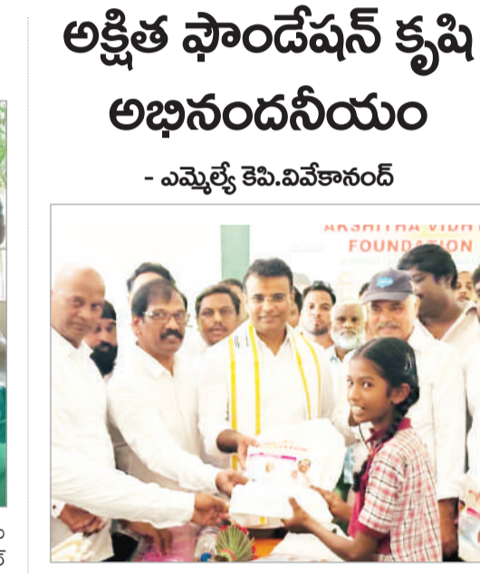
అక్షిత ఫౌండేషన్ కృషి అభినందనీయం - ఎమ్మెల్యే కె.వి.విశ్వనాథ్