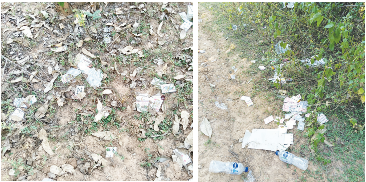
పినపాక, అక్టోబర్ 27, నినాదం న్యూస్ ప్రతినిధి భద్రాద్రి కొత్తగూడెం జిల్లా పినపాక మండలం ఉప్పాక, పెంటన్నగూడెం, బొమ్మరాజుపల్లి

లక్షలు చేతులు మారుతున్న తీరు - పోలీస్ శాఖ దృష్టి సారించాలి