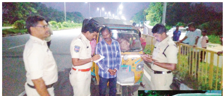
కోడూడ (మునగాల), అక్టోబర్ 27 (నినాదం న్యూస్):