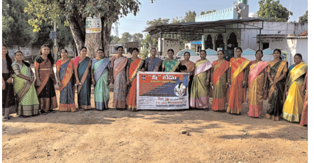
ప్రమాదం ఉన్నట్లయితే, బెదిరింపులకు గురైతే వెంటనే 100 నంబర్ కు డయల్ చేయాలని తెలిపారు. ఈ కార్యక్రమం లో గర్రపల్లి గ్రామ మహిళలు పాల్గొన్నారు.

సుల్తానాబాద్, అక్టోబర్ 27 (నినాదం న్యూస్): రామగుండం సి.పి ఆదేశాల మేరకు, షీ టీం ఇంచార్జ్ ఏఎస్.బి.ఎల్.ఎస్.ఆర్.లో సుల్తానాబాద్ మండలం గర్రపల్లి గ్రామంలో ఆదివారం మహిళలకు షీ టీం అవగాహన సదస్సుని నిర్వహించారు. ఈ సందర్భంగా షీ టీం సేవలను మూల్యాంకనం చేసి భద్రత, ఆన్‌లైన్ మోసాలపై ఆంటీ డ్రగ్స్ పై అవగాహన కల్పిస్తున్నామని అన్నారు. అలాగే మహిళల రక్షణ కోసం ప్రతి రోజు కన్స్టాంట్ ప్రధాన చౌరస్తాలో జన సమీకరణ ప్రాంతాల్లో కాలేజీలవద్ద షీ టీం ని రంతరంగా ఉంచడం జరుగుతుందని, ఎవరైనా వే ధింపులుగురి చేస్తే మహిళలు విద్యార్థులు భయ పడకుండా 6303923700 నంబర్ కు ఫోన్ చేసి సమస్య తెలపాలని కోరారు. ఫోన్ చేసిన వారి వివరాలు గోప్యంగా ఉంచడం జరుగుతుందని స్పష్టం చేశారు. అలాగే అత్యాచరణ పోయి సైబర్ క్రైమ్ ఆన్‌లైన్ మోసాలకు లోన్ యాప్ ల జోలికి పోకుండా ఉండాలని, ఎవరైనా ఆన్‌లైన్ మోసాలకు గురైతే సై బర్ క్రైమ్ హెల్ప్ లైన్ నెంబర్ 1930 కి సమాచారం ఇవ్వాలని, అలాగే మహిళలకు ఏదైనా