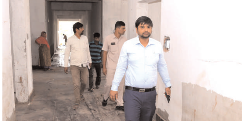
అందుబాటులో ఉండే విధంగా డ్రగ్ స్టోర్ ఏర్పాటు చేయడం జరుగుతుందని తెలిపారు.