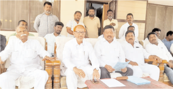
కరీంనగర్, అక్టోబర్ 29(నినాదం న్యూస్)