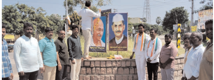
జమ్మికుంట, అక్టోబర్ 2 (నినాదం న్యూస్) : సత్యాగ్రహమే ఆయుధంగా అహింసా మార్గంలో శాంతియుతంగా పోరాడి కోట్లాది భారతీయులకు