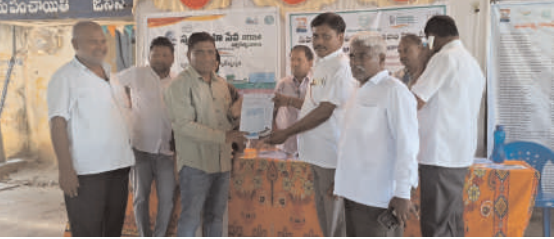
భీమదేవరపల్లి అక్టోబర్ 2 (నినాదం న్యూస్) : హనుమకొండ జిల్లా భీమదేవరపల్లి మండలంలో బుధవారం రోజు గాంధీ జయంతి సందర్భంగా అన్ని గ్రామ పంచాయతీలలో గ్రామసభలు నిర్వహించారు. ముల్కనూర్ గ్రామపంచాయతీలో ఏర్పాటుచేసిన గ్రామసభలో ప్రత్యేక అధికారి ఎంపిడిఓ పాల్గొన్నారు. స్వచ్ఛాహి సేవ కార్యక్రమంలో భాగంగా గ్రామపంచాయతీ కార్మికులకు ఇన్సూరెన్స్ చేయించి ప్రత్యేక సన్మానం అందించడం జరిగింది. ఈ సందర్భంగా గ్రామపంచాయతీ కార్మికులను సన్మానించారు. ఉపాధి హామీ