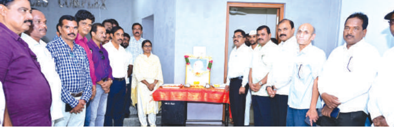
మతాలు కులాలు సంస్కృతుల సమ్మేళనంతో ఉన్నా కూడా అందరినీ ఒకే తాటిపైకి తెచ్చిన వ్యక్తి అన్నారు. గాంధీజీ రచనలు కార్యక్రమాల ద్వారా ప్రజలు చైతన్యం కావాలని చెప్పారు. ఆయన రచించిన పుస్తకాలు చదవడం ఉపన్యాసాలు వినడం ద్వారా స్ఫూర్తి ని పొందవచ్చు అని చెప్పారు. మన దేశం సుభిక్షంగా ఉండటానికి కారణం ఎందరో మహానీయుల త్యాగ ఫలితమే