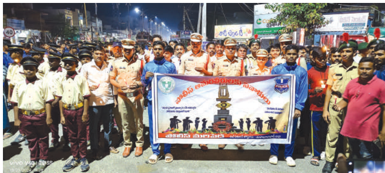
దోర్నకల్ /మరిపెడ అక్టోబర్ 23(నినాదం స్టూన్ ): వీధి నిర్వహణలో ప్రాణాలు అర్పించిన పోలీసు సిబ్బంది త్యాగలను