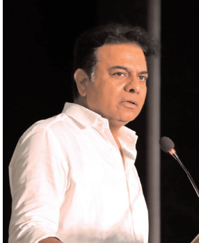
అన్నారు. దీంతో భూముల ధరలు కూడా పెరిగాయని అన్నారు. తన తాతకు 400 ఎకరాల ఆస్తి

హైదరాబాద్, నవంబర్ 5 (నినాడం): ఉమ్మడి ఏపీలో రైతులకు మేలు చేయాలని పాలకులు ఆలోచించ లేదని భారాస కార్యనిర్వాహక అధ్యక్షుడు కేబీఆర్ అన్నారు. ప్రత్యేక తెలంగాణలో కేసీఆర్ రైతుల బాగు గురించి ఆలోచించి సాగునీటి రంగానికి ప్రాధాన్యం ఇచ్చారని