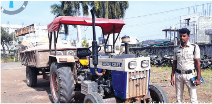
- ట్రాక్టర్ డ్రైవర్, ఓనర్ పై కేసు నమోదు - కాటారం ఎస్పి, మ్యాక అభినవ్

కాటారం, సచివాలయం 25, నినాదం స్కూల్ కాటారం మండల కేంద్రానికి రాత్రి సమయంలో మానేరు నుండి ఇసుక రవాణా చేస్తున్నారనే సమాచారంతో పోలీస్ సిబ్బంది పెట్రోలింగ్ చేస్తూ గంగాంర మూలములుపు వద్దకు చేరుకునే సరికి ఇసుక లోడ్లో వస్తు పోలీస్ పార్టీకి