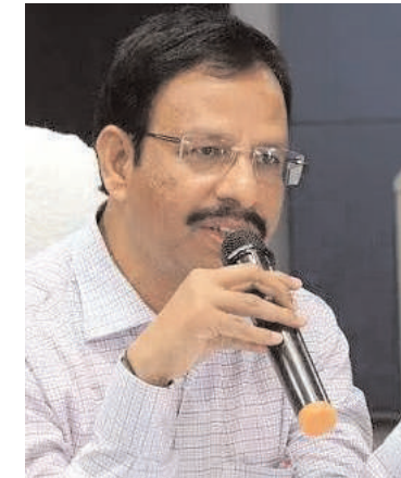
మహాలక్ష్మి వధకం తదితర అంశాలపై హైదరాబాద్ బస్‌భవన్ నుంచి ఉన్నతాధికారులు