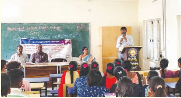
కొడంగల్ నవంబర్ 2 (నినాదం న్యూస్)