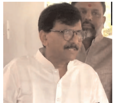
రౌత్ అన్నారు. ఎంపీ అరవింద్ చేసిన

ముంబై, నవంబర్ 2 (ఆర్ఎన్ఎ): ఉద్ధవ్ రాక్షకు చెందిన శివసేన పార్టీ ఎంపీ అరవింద్ సావంత్.. షిండే వర్గానికి చెందిన శివసేన నేత పైనా ఎన్సీపై తీవ్ర వ్యాఖ్యలు చేశారు. ఆమె ఇంపోర్టెడ్ మూల్ అంటూ ఆయన విమర్శించారు. ఎంపీ అరవింద్ చేసిన వ్యాఖ్యలను శివసేన నేత సంజయ్ రౌత్ సమర్థించారు. తమ పార్టీ ఎంపీని ఆయన డిఫెండ్ చేసుకున్నారు. తమ నేత ఎవరినీ అవమానించలేదని, అరవింద్ సావంత్ తమ సీనియర్ ఎంపీ అని, ముంబాదేవి స్థానానికి చెందిన బీజేపీ నేత పైనా ఎన్సీ బయటి వ్యక్తి అని, ఆమె ముమ్మాటికీ ఇంపోర్టెడ్ మూల్ అని