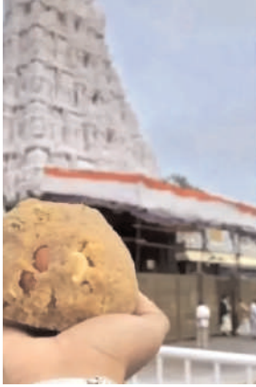
లడ్డూలు వస్తున్నట్లు సమాచారం. ఈ నేపథ్యంలో కొంతమంది ఆలయ సిబ్బంది లడ్డూలను ధనికులకు భక్తుల నివాసాలకు తీసుకెళ్లి ఇస్తున్నట్లు సమాచారం.

చెన్నై, నవంబర్ 5 (సినాడం న్యూస్) : ఖరీదైన భక్తుల చెంతకు చేర్చేందుకు కొంతమంది టీటీపీ సిబ్బంది ప్రయత్నిస్తున్నట్లు ఆరోపణలు వెల్లువెత్తుతున్నాయి. టీటీపీ ఆధ్వర్యంలో టీ.నగర్ వెంకటనారాయణారోడ్డులో వెంకటేశ్వరస్వామి ఆలయం ఉన్న విషయం తెలిసిందే. తిరుమల తరహాలోనే ఇక్కడూ ఆలయ ప్రాంగణంలోనే లడ్డూలను విక్రయిస్తుంటారు. అయితే గత కొంతకాలంగా వారానికి రెండుసార్లు తిరుమల నుంచి లడ్డూలు వస్తుండడంతో భక్తులకు విరివిగా లభ్యమవుతున్నాయి. కొన్నిసార్లు అవసరానికి మించి