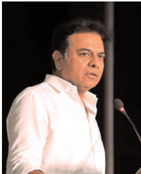
అన్నారు. దీంతో భూముల ధరలు కూడా పెరిగాయని అన్నారు. తన తాతకు 400 ఎకరాల ఆస్తి

హైదరాబాద్, నవంబర్ 5 (నినాదం): ఉమ్మడి ఏపీలో రైతులకు మేలు చేయాలని పాలకులు ఆలోచించ లేదని భారాస కార్యనిర్వాహక అధ్యక్షుడు కేబీఆర్ అన్నారు. ప్రత్యేక తెలంగాణలో కేసీఆర్ రైతుల బాగు గురించి ఆలోచించి సాగునీటి రంగానికి ప్రాధాన్యం ఇచ్చారని