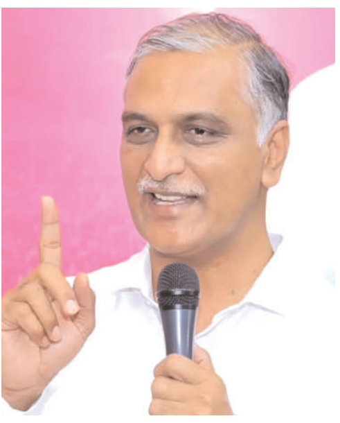
హైదరాబాద్ కు వస్తున్న విరీరు ఒకసారి అశోక్ నగర్ ను సందర్శించి ఆ విద్యార్థులతో మాట్లాడి.. వారి ఆవేదనను విన్నాడి, శోక నగర్ గా మార్చిన విరీ ప్రభుత్వ తీరును చూడండి. విరీరు వాగ్దానం చేసిన 2 లక్షల ఉద్యోగాల్లో కనీసం 10? ఉద్యోగ

హైదరాబాద్, నవంబర్ 5 (సినాడం న్యూస్) : హైదరాబాద్ కు వస్తున్న రాహుల్ గాంధీ ముందుగా అశోక్ నగర్ వెళ్లాలని మాజీ మంత్రి, బిఆర్ఎస్ ఎమ్మెల్యే హరిష్ రావు డిమాండ్ చేశారు. ఈ మేరకు రాహుల్ ను ఉద్దేశిస్తూ ఎక్స్ లో పోస్టు చేశారు. హైదరాబాద్ కు వస్తున్న రాహుల్ గాంధీ.. అశోక్ నగర్ వెళ్లాలని.. అక్కడి నిరుద్యోగ యువతను కలవాలని.. ఆ యువత పట్ల ప్రభుత్వం ఎలా ప్రవర్తించిందో చూడాలంటూ సోషల్ విరీడియా ఎక్స్ లో మాజీ మంత్రి పోస్టు చేశారు. ఇటీవల గ్రూప్ 1 విద్యార్థుల ఆందోళనలతో హైదరాబాద్ లోని అశోక్ నగర్ లో తీవ్ర హైటెన్షన్ వాతావరణం నెలకొన్న విషయం తెలిసిందే. జీవో నెంబర్ 29 ను రద్దు చేసి జీవో నెం 55 ను అమలు చేయాలంటూ నిరుద్యోగులు ఆందోళనకు దిగారు. పెద్ద ఎత్తున నిరుద్యోగులు నిరసనకు దిగడంతో తీవ్ర ఉద్రిక్తత