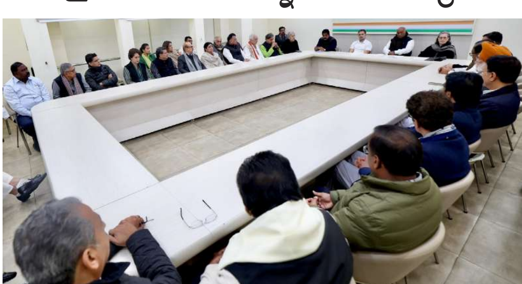
దేశం కోసమే తన జీవితాన్ని దారపోశారు మన్మోహన్ వారసత్వాన్ని ముందుకు తీసుకెళ్లాలని సీడబ్ల్యూసీ ప్రత్యేక సమావేశంలో తీర్మానం