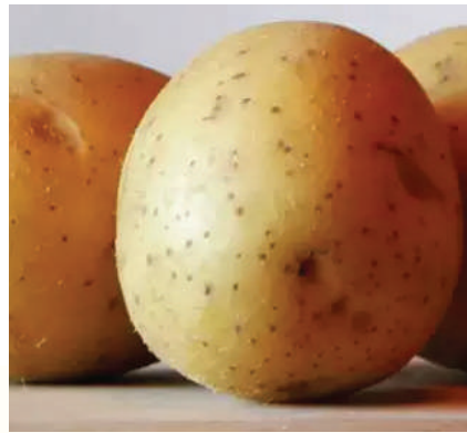
అవగాహన కోసమే. అందం, ఆరోగ్యానికి సంబంధించిన ఏ చిన్న సమస్య ఉన్నా వైద్యులను సంప్రదించడమే ఉత్తమ మార్గం. గమనించగలరు.