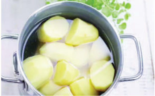
పాలు ఆరనివ్వండి. ఆ తర్వాత గోరువెచ్చని నీటితో కుళ్లం చేసుకోండి. ఇలా వారానికి రెండు సార్లు చేస్తే.. పిగ్గింటేషన్ సమస్య దూరం అవుతుంది.

బంగాళాదుంప, తేనె ప్యాక్... బంగాళాదుంపను ఉడకబెట్టి, ఆ తర్వాత మెత్తని షేన్డ్ లో చేయాలి. బంగాళాదుంప గుజ్జులో ఒక టేబుల్ స్పూన్ తేనె వేసి మిక్స్ చేయాలి. ఇది రెండు రోజుల కోసం వారానికి రెండు సార్లు ఇలా చేయాలి.